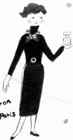
Leslie Caron in An American in Paris

就這樣，我的電影人生揭開了序幕。 高中時代開始，養成了看二輪電影的習慣； 大學時代比較忙，但一有時間就會去報到。 成為社會新鮮人後，二輪電影院漸漸退出鬧區， 而我仍然會為了看場電影而不辭千里。