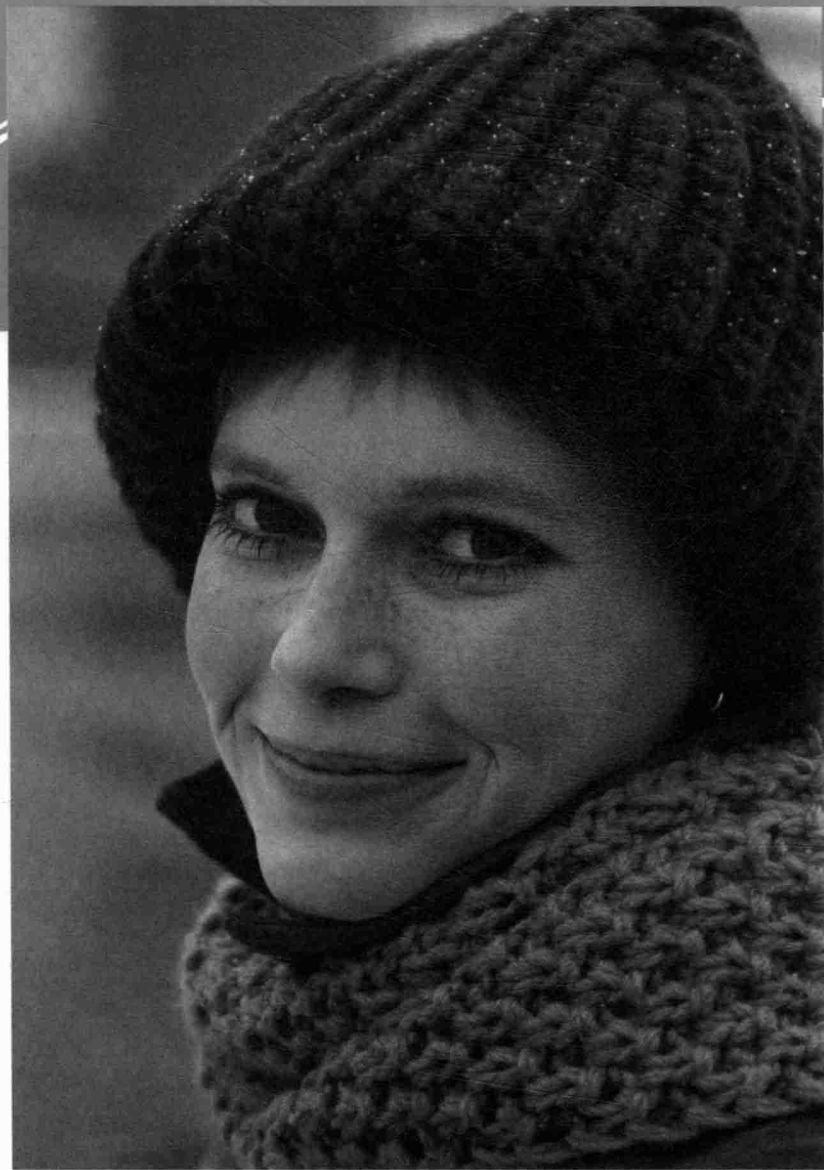
《約翰與瑪莉》（John and Mary，1969年／美國）（→ P.12、P.134）