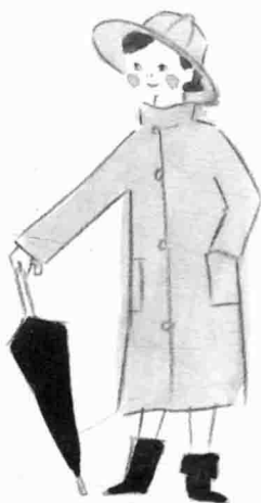
Debbie Reynolds in Singin' in the Rain