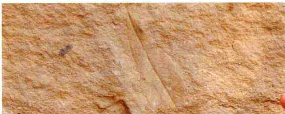
2500万年前的中华木兰化石

这里生发、演化，出现了花果的同时，包括宽叶木兰在内的许多山茶科近缘植物，也开始在这里繁衍生长，为茶树物种的孕育形成创造了条件。到新生代第三纪的中新世，波澜壮阔的喜马拉雅山造山运动开始了，经过漫长的历史时光，青藏高原高高隆起，横断山脉也随之出现，昔日几乎是一马平川的云南大地隆起成为了高原。到新生代第四纪，由于地球史上距今最近的一次大冰川期来临，许多喜温喜热的第三纪区系植物遭到破坏。云南的南部和西南部幸运地躲过了这次冰川袭击的浩劫，保留下了许多新生代第三纪遗存的物种，如滇南木莲、树蕨、鸡毛松、苏铁、古莲等，起源于第三纪早期的山茶植物也得以在这片土地上继续滋生、演化、繁盛起来。