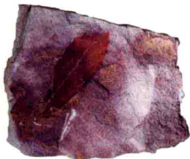
有3540万年历史的景谷宽叶木兰化石

1978年，地质勘探人员在地处普洱市景谷盆地的芒现村，发现了以宽叶木兰（新种）为主体的景谷植物群化石，并正式被中国科学院北京植物研究所和南京地质