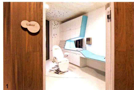
图1 公园诊所的诊查室。x architekten 设计。详见第 58 页。