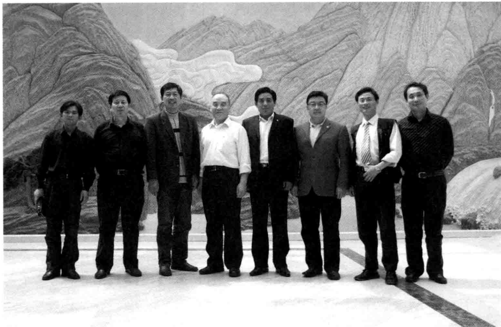
杨小波(右三)等国家政协机关领导 2008 年在北京会见枞阳“文化兴县”采访团

使人不远万里往而亲之。一个人是这样，一个县亦如此。一个地方的形象对经济发展影响很大，会成为人们寻求经济合作伙伴时认真考虑的重要因素。