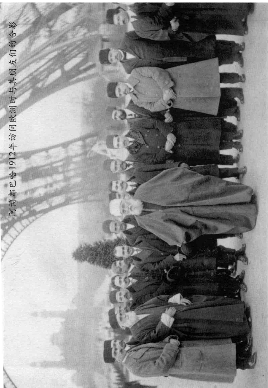
阿博都巴哈1912年访问欧洲时与其朋友们的合影