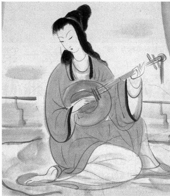
►美丽温婉、娴静典雅的东方女性

今天的女性，能够优雅天成的或许 有 之，但却犹如凤毛麟角。我们见到更多的则是在庸常生活、扰攘俗世中怀着对美的渴慕却不得其道的女性。今天这个急功近利的时代对于物质的看重，让我们渐渐多了浮躁，少了沉静下来慢品优雅的心境。曾几何时，那些曾经存在于