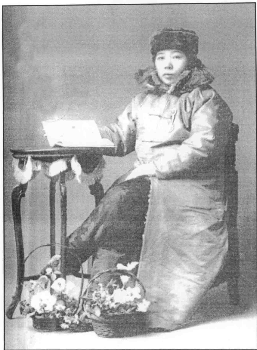
唐群英全身照（1912年冬摄于北平，原载于1916年美国世纪出版社出版的《现在的中国》一书）