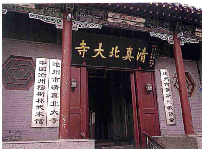
河北沧州北大寺，始建于明代