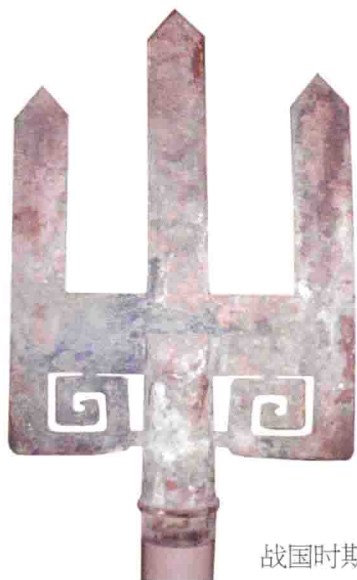
战国时期河北平山中山王墓出土的山形器