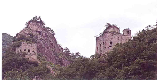
河北青龙满族自治县铁瓦乌龙殿遗址