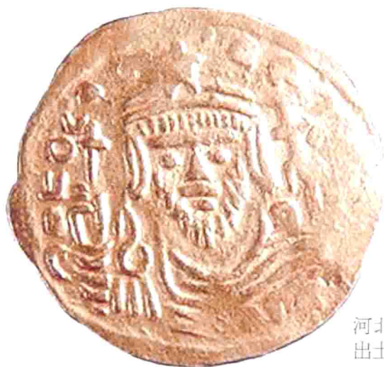
河北磁县东魏茹茹公主墓 出土的拜占庭金币