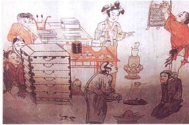
河北宣化辽墓壁画中的茶道图