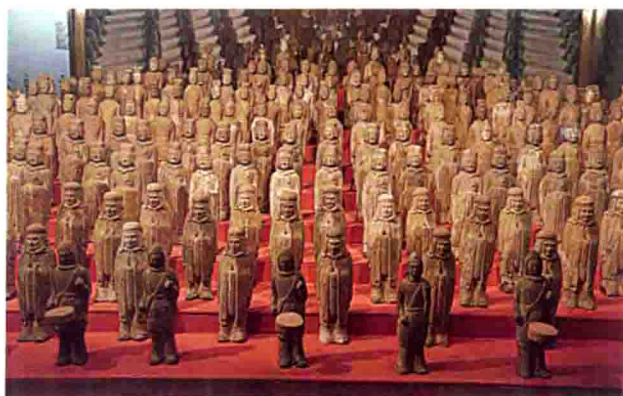
河北磁县东魏茹茹公主墓出土的陶俑