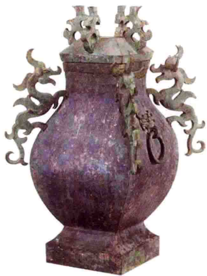
战国时期河北平山中山王墓出土的铜方壶