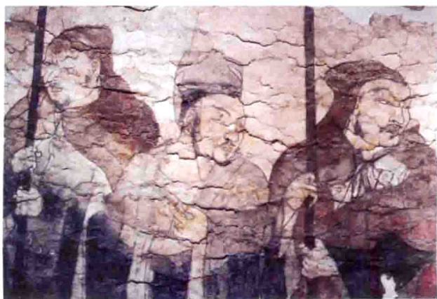
河北磁县湾漳北朝墓 壁画局部