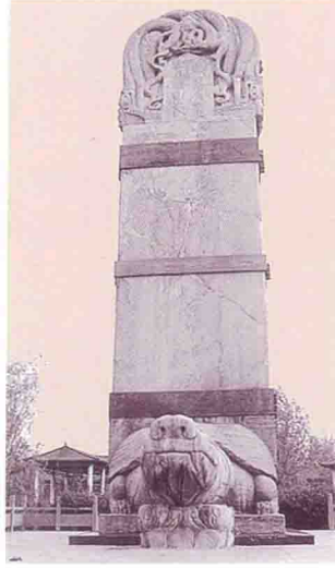
河北大名唐代 何进滔德政碑