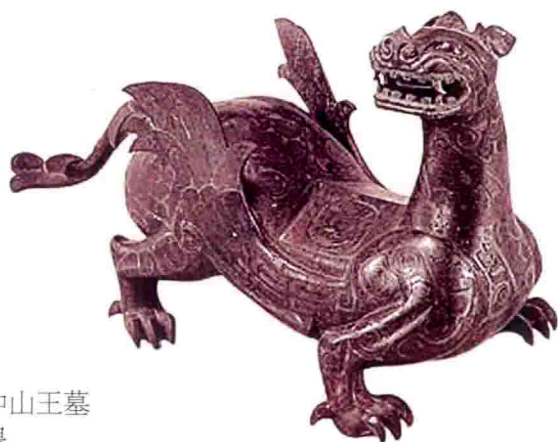
战国时期河北平山中山王墓出土的错银双翼神兽