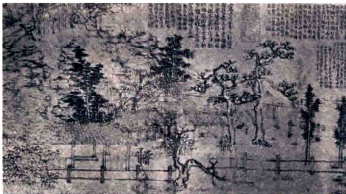
倪瓒绘苏州狮子林图