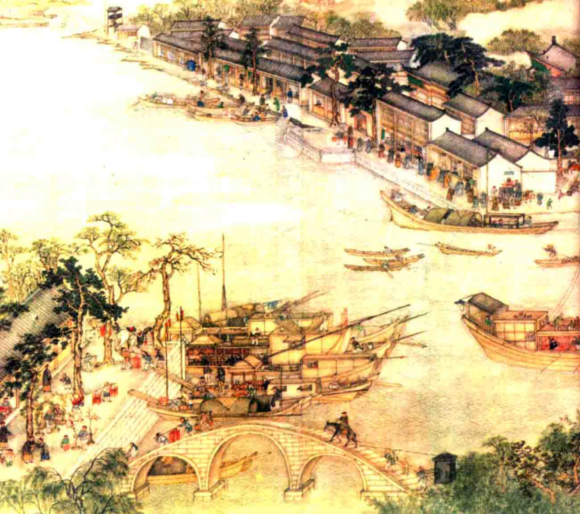
清人画中的苏州城

诸城市多是商业和手工业的重要产地，明清两代，手工业的迅速发展，出现资本主义经济的萌芽，苏州更加繁荣发展。明代苏州一府的田赋就占了全国的十分之一左右。明代中叶，苏州产生了资本主义萌芽，土地肥沃、物产丰富的苏州，同时又成为商业城市。交通便捷，商贩云集，社会日见繁荣。富足的社会经济条件为园林的建设提供了充足的物质支持。