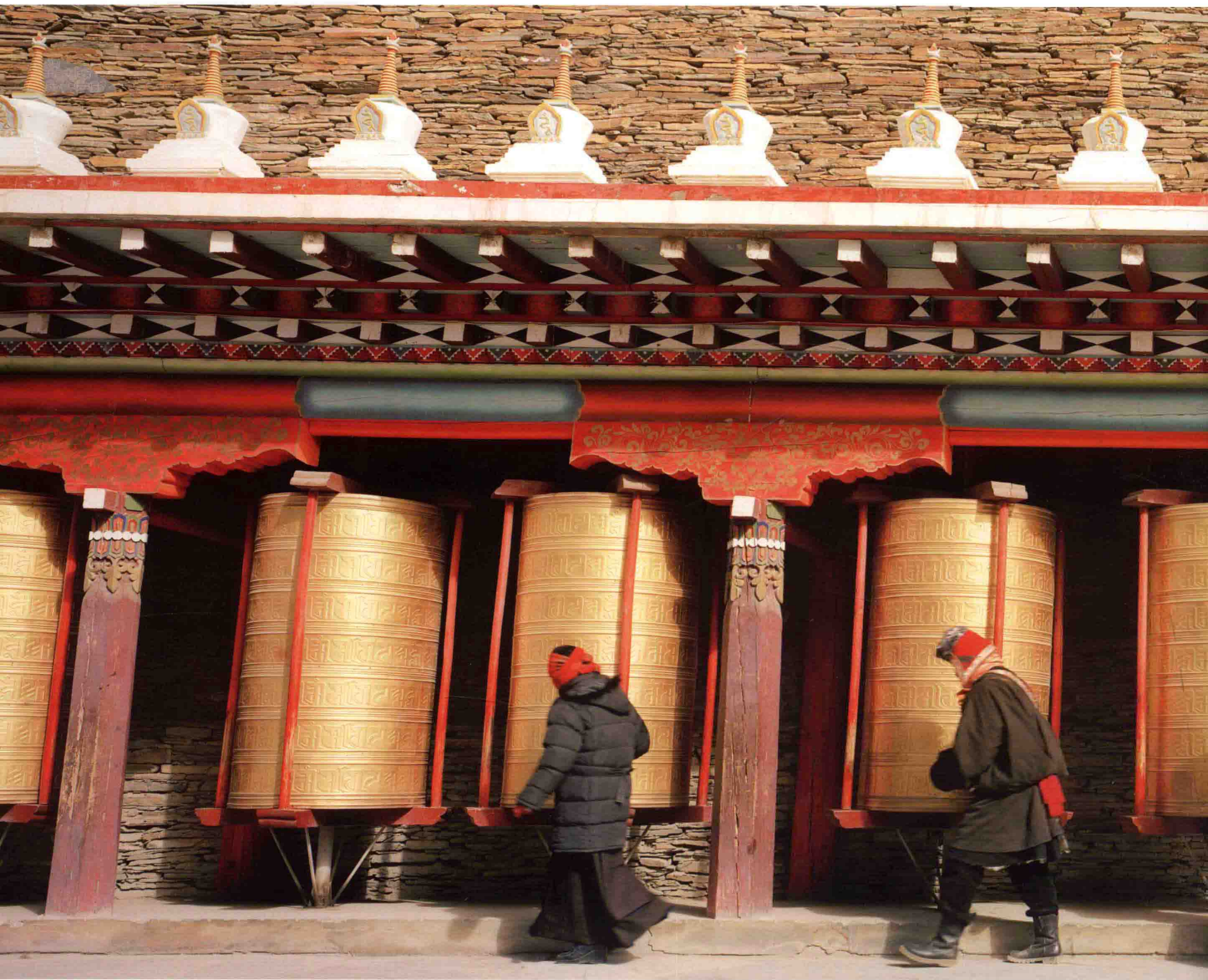
2008年1月 摄于四川康定塔公草原