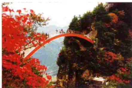
神农架燕天风景区