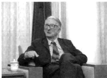
韩礼德 (M. A. K. Halliday), 1925—

20世纪70年代初期，著名语言学家 M. A. K. Halliday 发表了一系列主题相同的论文，全面论述他的社会符号学理论。后来这些论文被整理成集出版，书名为《作为社会符号的语言：从社会角度诠释语言与意义》（1978）。社会符号学理论试图解释人类交际与社会过程中的变化、不规则和不和谐，试图解释社会结构的符号特征，包括社会阶级、权力等级系统、社会冲突各个方面的语义特征。同时，社会符号学还试图解释社会成员构建社会符号、社会现实被塑造、限制、修改的过程。而这些过程对社会现实的构建并不如理想所描述的那样，相反，往往会对短视、偏见、