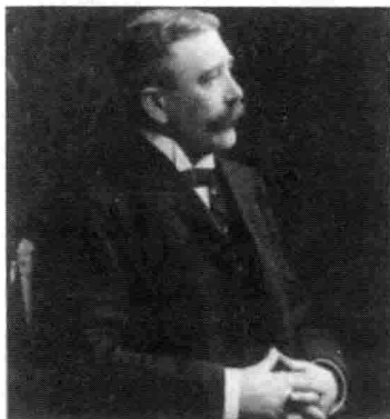
索绪尔 (Ferdinand de Saussure)