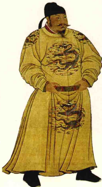
唐太宗李世民画像

这时候，藏族英明的国王松赞干布（公元617~650年）建立了一个统一的吐蕃王朝。唐贞观三年（629年），他才十三岁，就挑起吐蕃赞普的重任，征集了万余人，组成一支精锐之师，经过三年征战，平定了内乱，完成了对青藏高原诸多小国的兼并，成为了一位最受吐蕃臣民拥戴的国王。公元632年率众部渡过雅鲁藏布江，把国都从当泽迁到逻些（今拉萨），无论从自然、地理、气候、军事、政治诸方面衡量，都为后人选定了—一个发展基业的好地方。松赞干布是个精明人，深知新朝初建，需要稳定图强，和睦邻邦。首先与西边邻国泥婆罗国（今尼泊尔）通好，他可谓富有政治远见，就连自己的婚姻，也充满“国家意识”。639年，他一方面迎娶泥婆罗国王鸯输伐摩之女尺尊公主入藏，解除了后顾之忧；另一方面又向东结交盛唐。贞观八年（634年），他派使者赴长安与唐朝通聘结好。唐太宗对吐蕃的首次通使也很重视，给予了隆重接待，并遣使到吐蕃回访。据《册府元龟》载，当松赞干布闻讯突厥与吐谷浑国王向唐王求亲该尚公主时，也不甘落后，乃遣使赴长安请婚，几次都未得唐太宗允许。血气方刚的松赞干布，便以武力逼婚，于是，贞观十二年（638年）爆发了唐蕃首次战争。“抢亲”未得效果，松赞干布一心要当