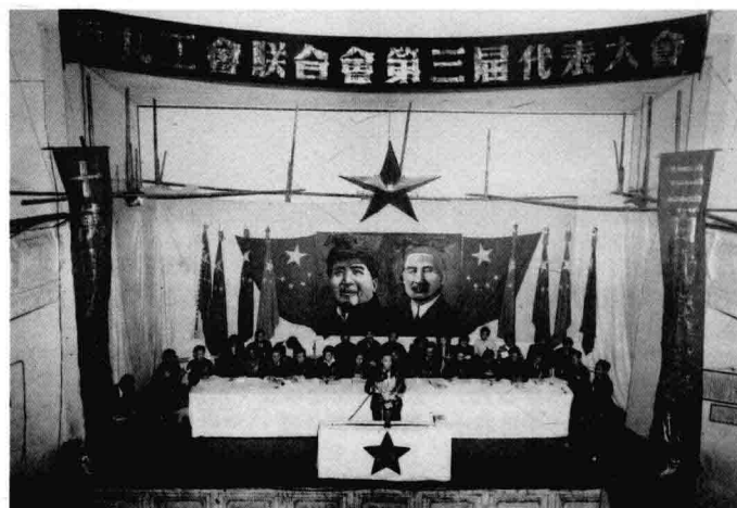
第三屆代表大會於1950年4月8至9日在加路連山孔聖堂舉行。