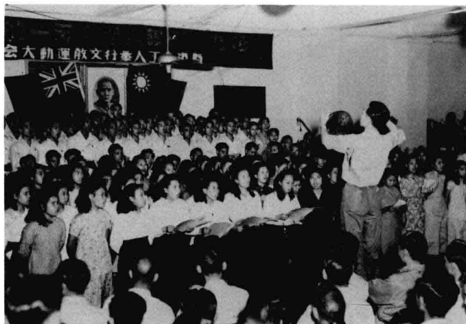
1949年4月，工聯會開展「全港工人文教運動」，讓工友通過學習或福利事業組織起來，以達到提高認識、活躍工會、擴大和鞏固工人團結之目的。文教運動的開展，同時培養了大批青年工會工作者。圖為1949年5月，工聯會舉行紀念「五·一」勞動節暨港九工人文教運動大會。