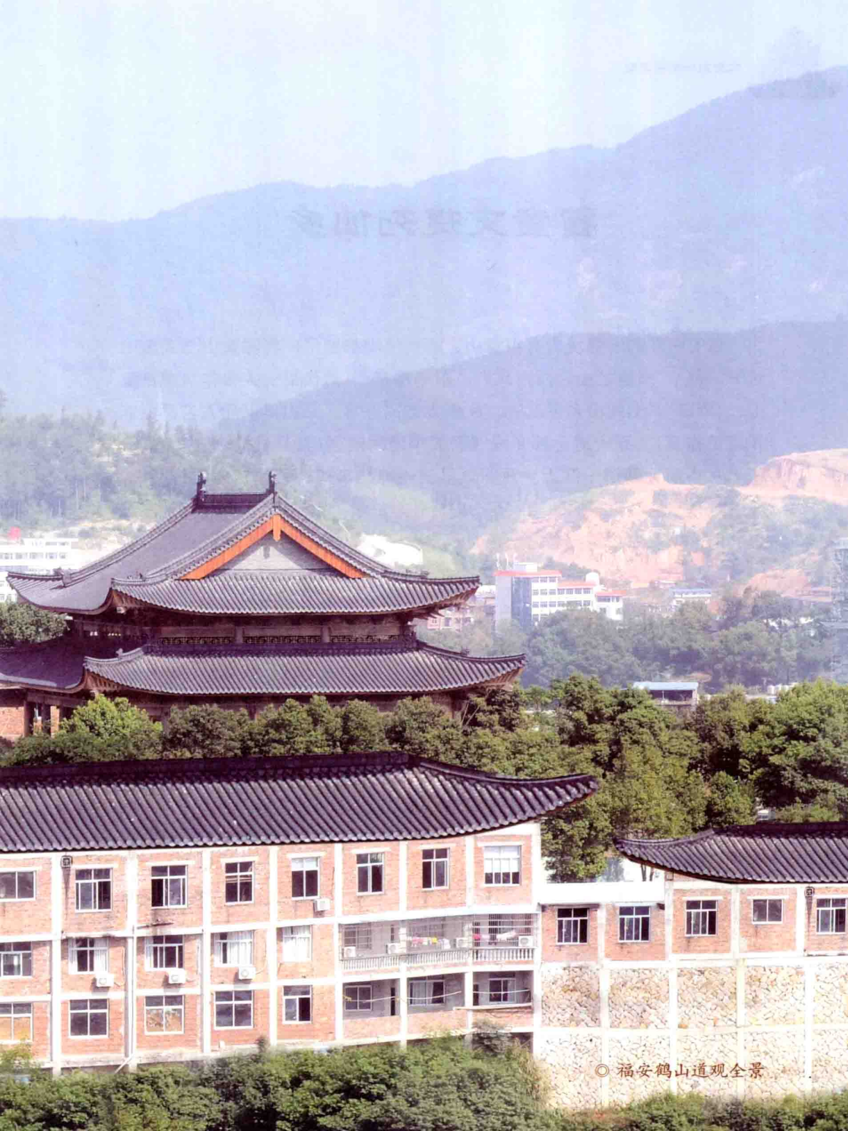
◎ 福安鹤山道观全景