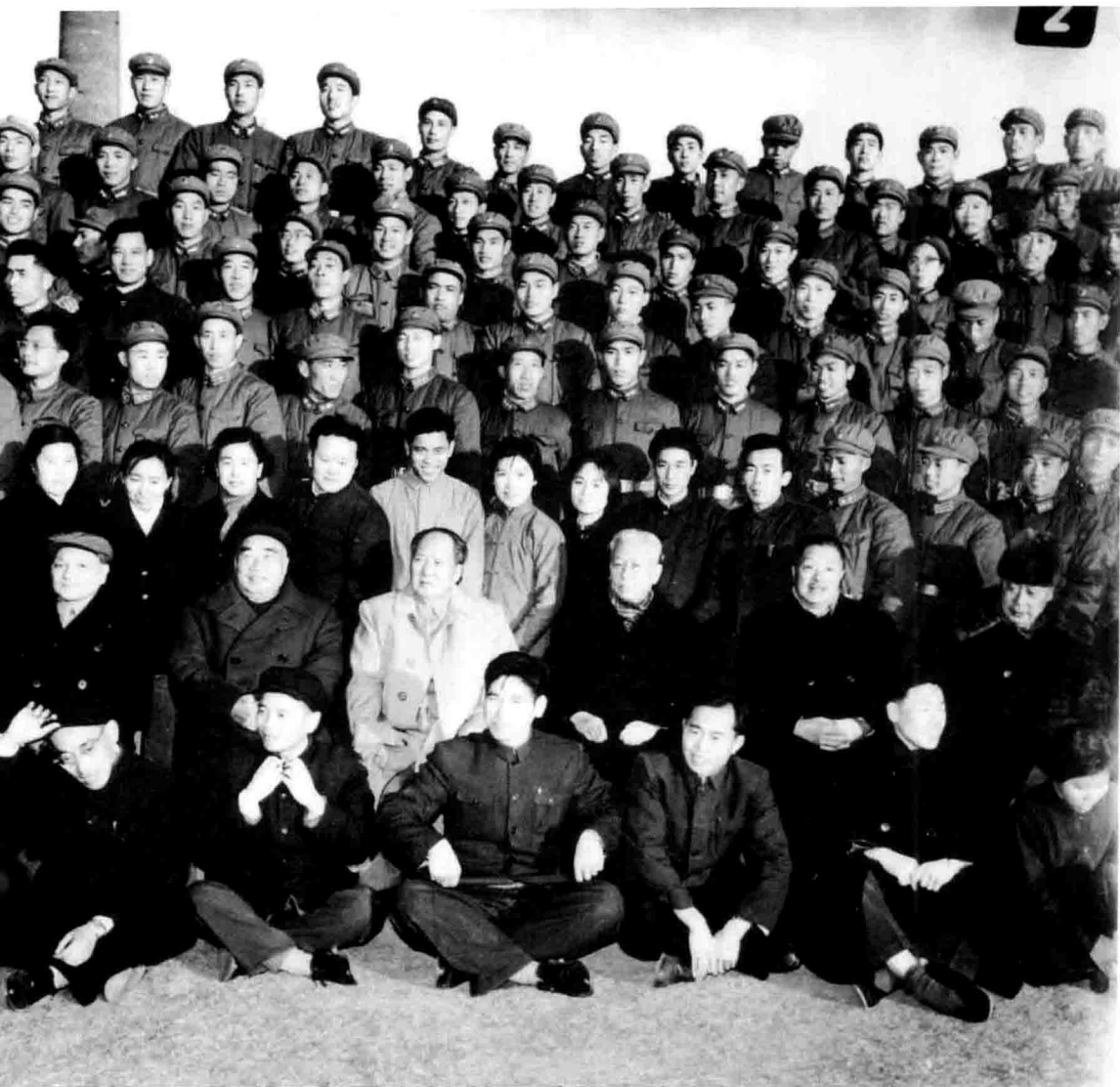
1959年11月27日，毛主席等中央领导人接见中央警卫局党代表（二排左起：邓小平、朱德、毛泽东、刘少奇、贺龙、陈毅；前排左三为作者；三排左一为作者夫人）