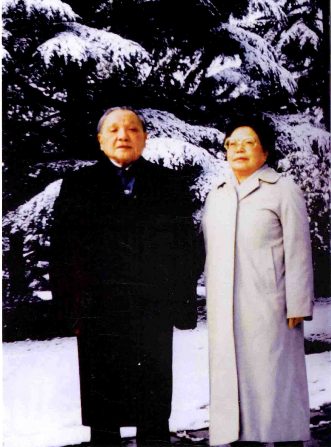
1990年，小平同志和夫人卓琳在上海西郊宾馆