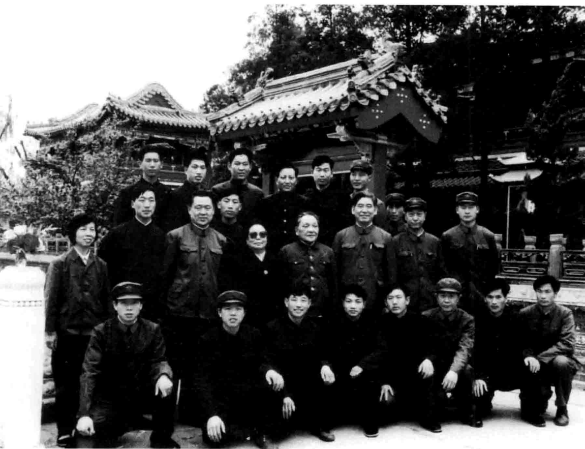
1986年4月，小平同志和夫人卓琳在瀛台与警卫官兵合影（二排右三为作者）