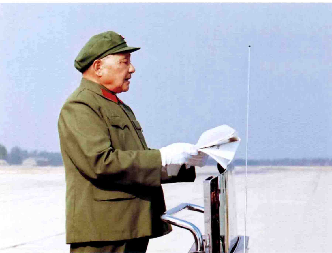
1981年9月，小平同志在张家口军事大演习阅兵后讲话