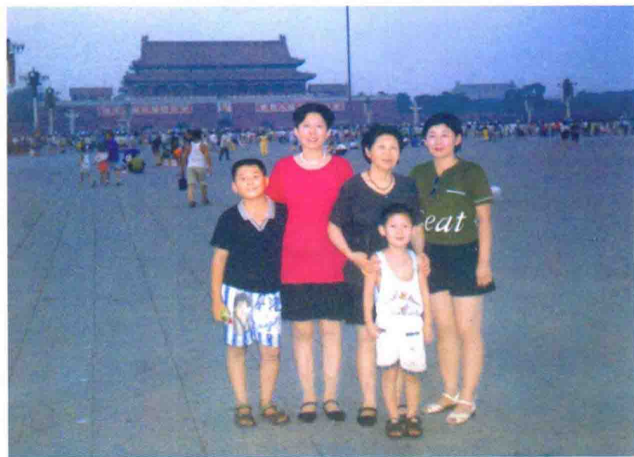
作者和女儿及外孙 98 年在天安门广场