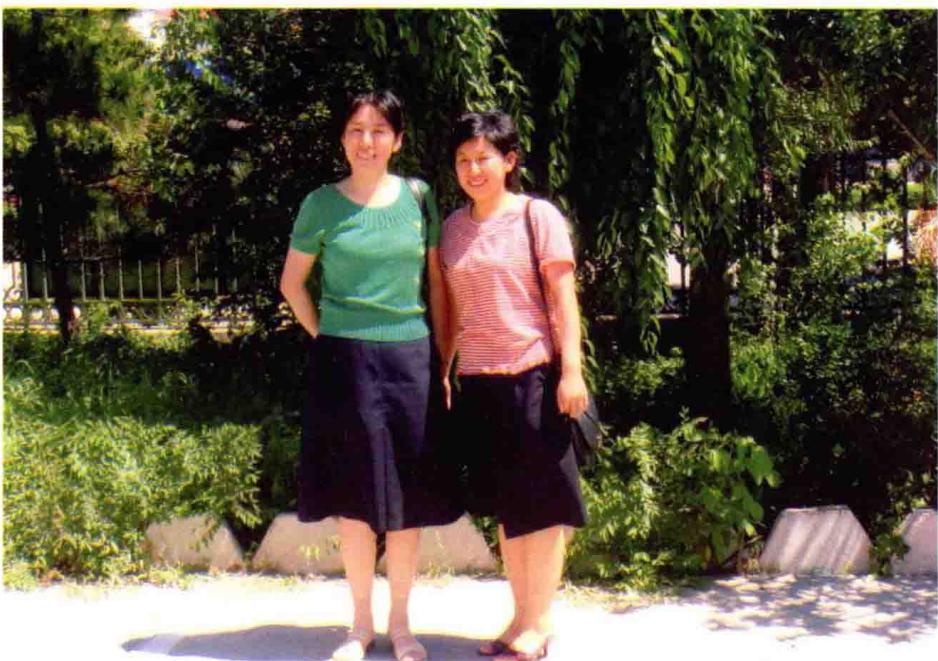
作者的两位女儿 2007 年于白城市公安局