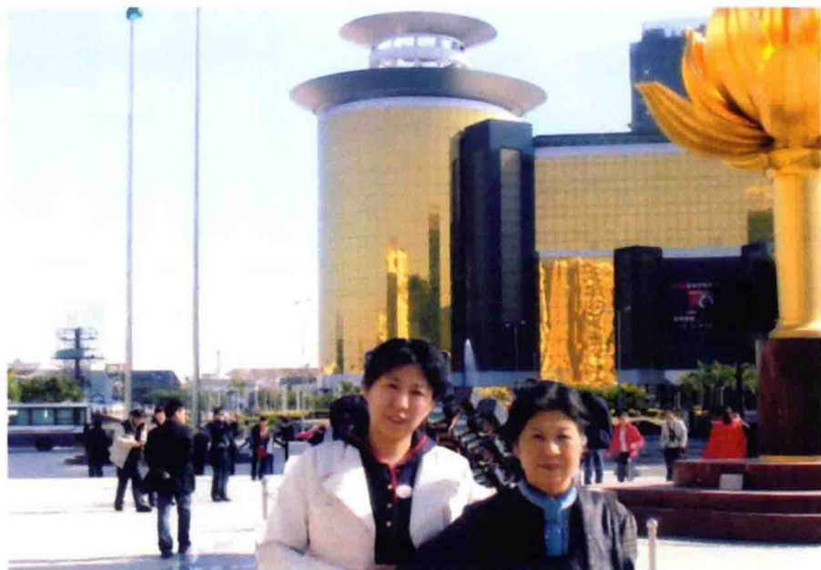
作者和大女儿 2007 年于澳门