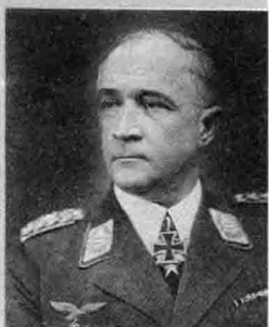
沃尔特·冯·勃劳希契