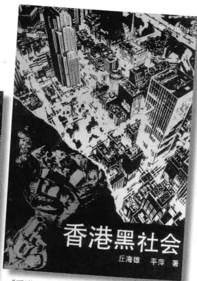
《香港黑社會》(1992)。這簡體字書是大陸九七熱下的出版，內容主要採自《香港黑社會活動真相》或報紙雜誌，沒有甚麼獨到之處。