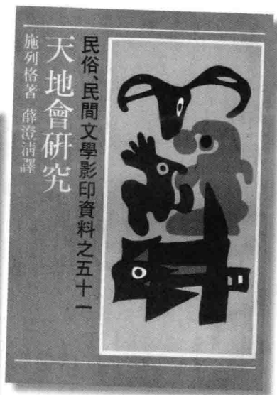
《天地會研究》中譯本。