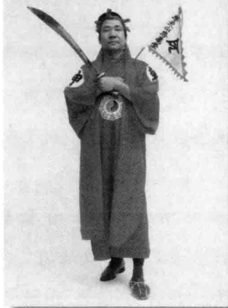
由香港警務人員編寫的 Triad Societies in Hong Kong (1960)。