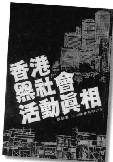
《香港黑社會活動真相》(1979)。