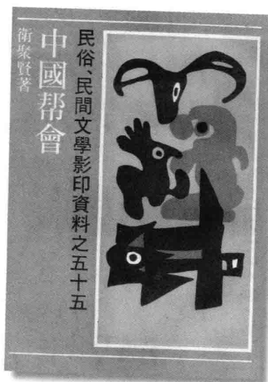
《中國幫會》(1947)，衛聚賢著。書中所說的都是北方青幫和紅幫的事，與香港三合會無關。