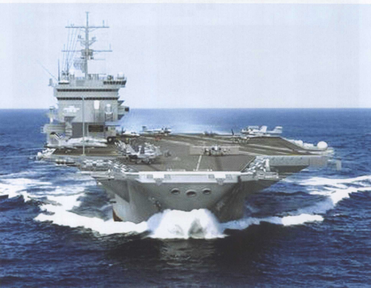
昂首挺进的美国“尼米兹”号航母