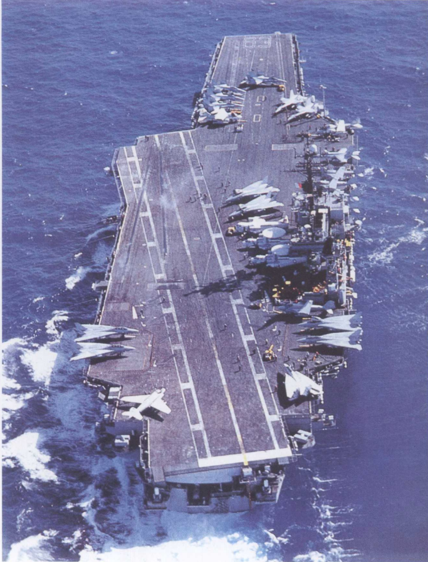
美国“小鹰”号航母后俯全貌