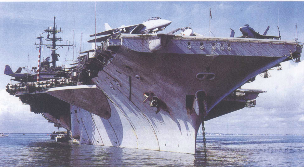
“美国”号——海湾战争中美国参战的7艘航母之一