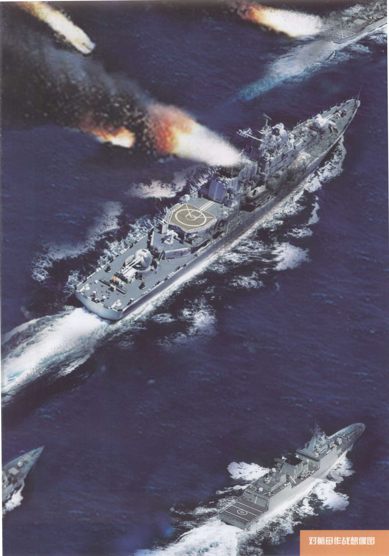
对航母作战想像图