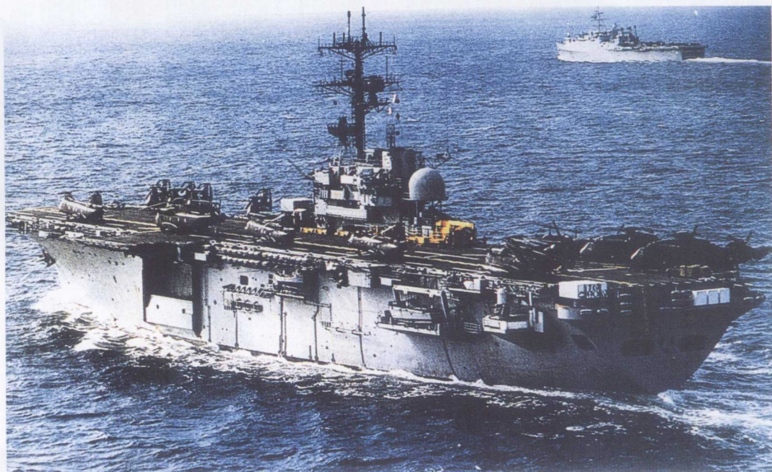
美国硫黄岛级“仁川”号