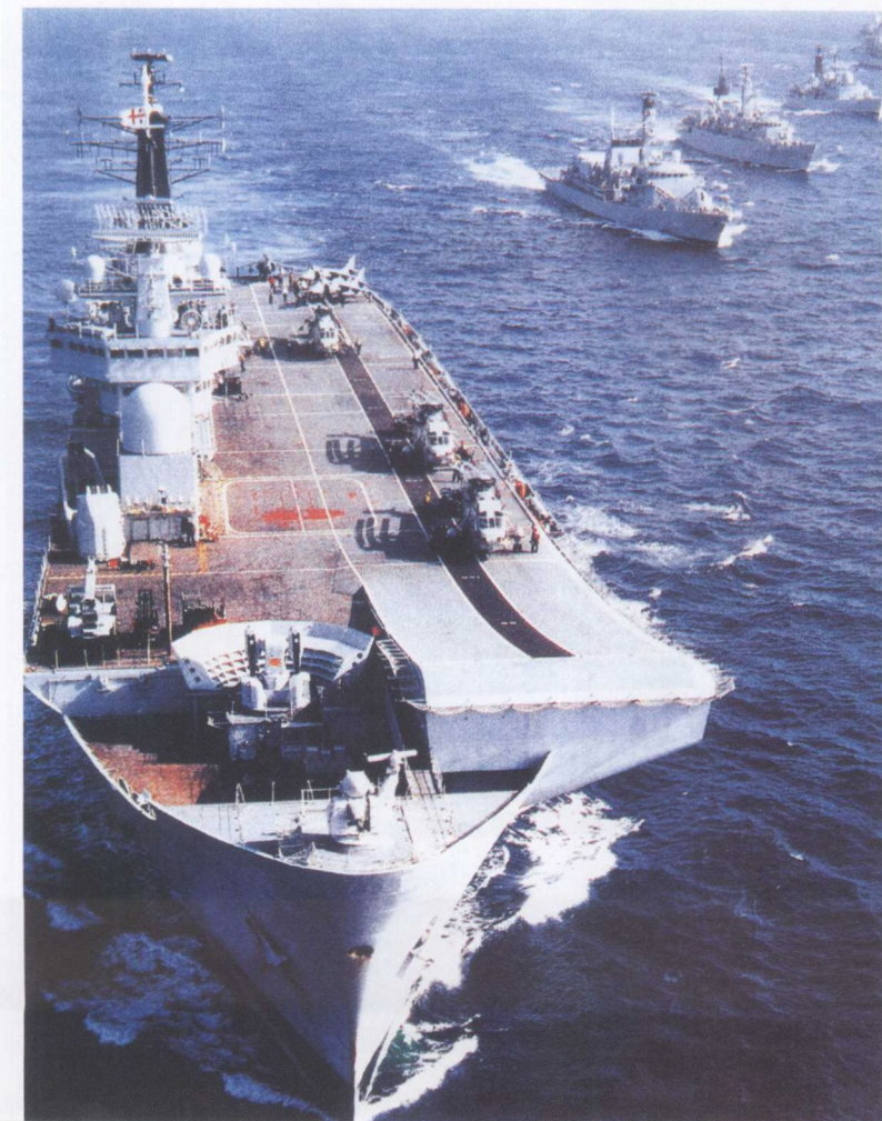
现代化改装的英国“无敌”号 航母编队