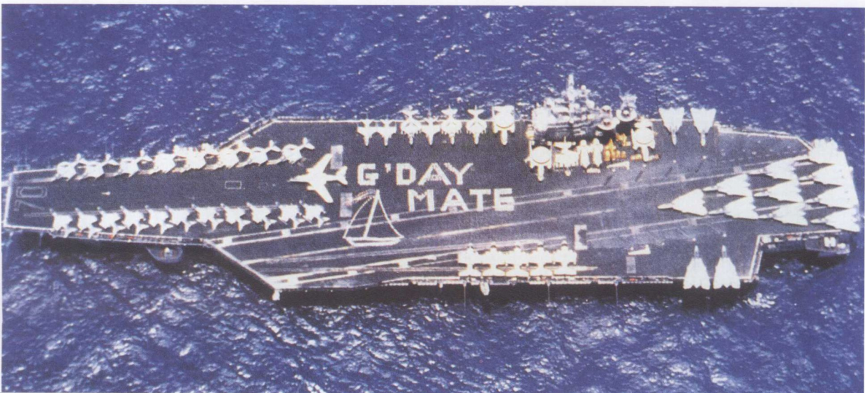
航行在太平洋上的美国 “卡尔·文森”号