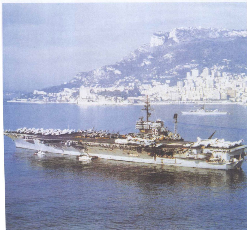
美国“美国”号停泊在法国尼斯海