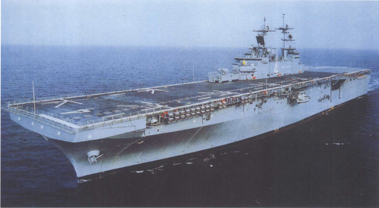
美国黄蜂级4号舰“拳师”号