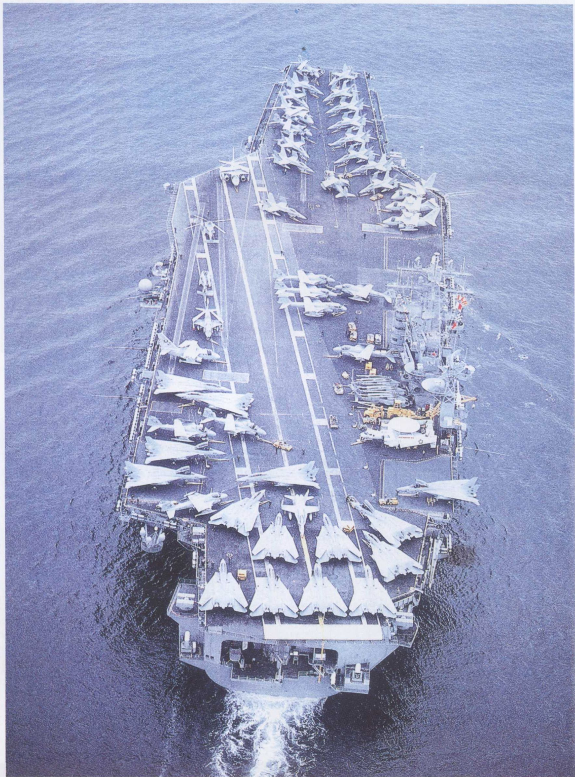
美国尼米兹级“卡尔·文森”号