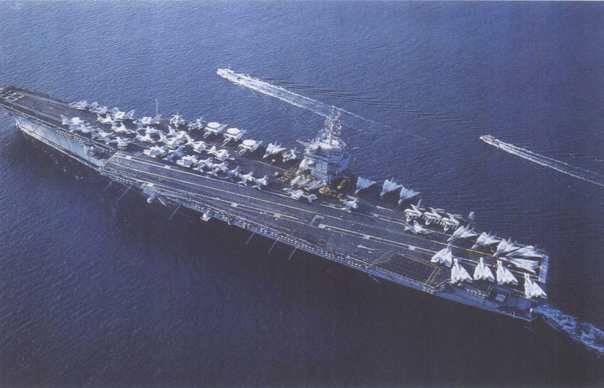
完成了现代化改装的美国“企业”号