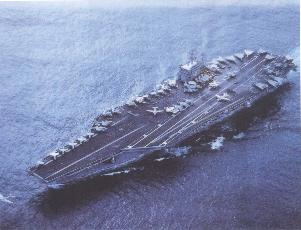
正在进行弹射起飞作业的美国“尼米兹”号航母