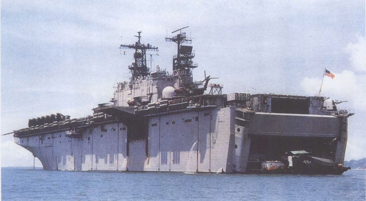
美国塔拉瓦级最后一艘舰“佩莱利乌”号