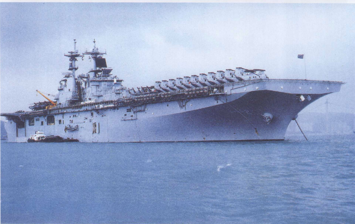
美国黄蜂级 2 号舰“埃塞克斯”号（上、下图）