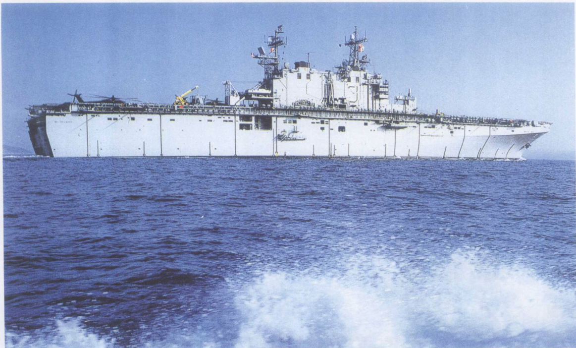
美国塔拉瓦级 3 号舰“贝劳·伍德”号