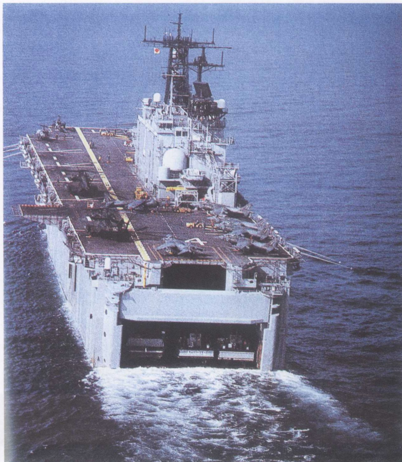
美国塔拉瓦级4号舰“拿骚”号