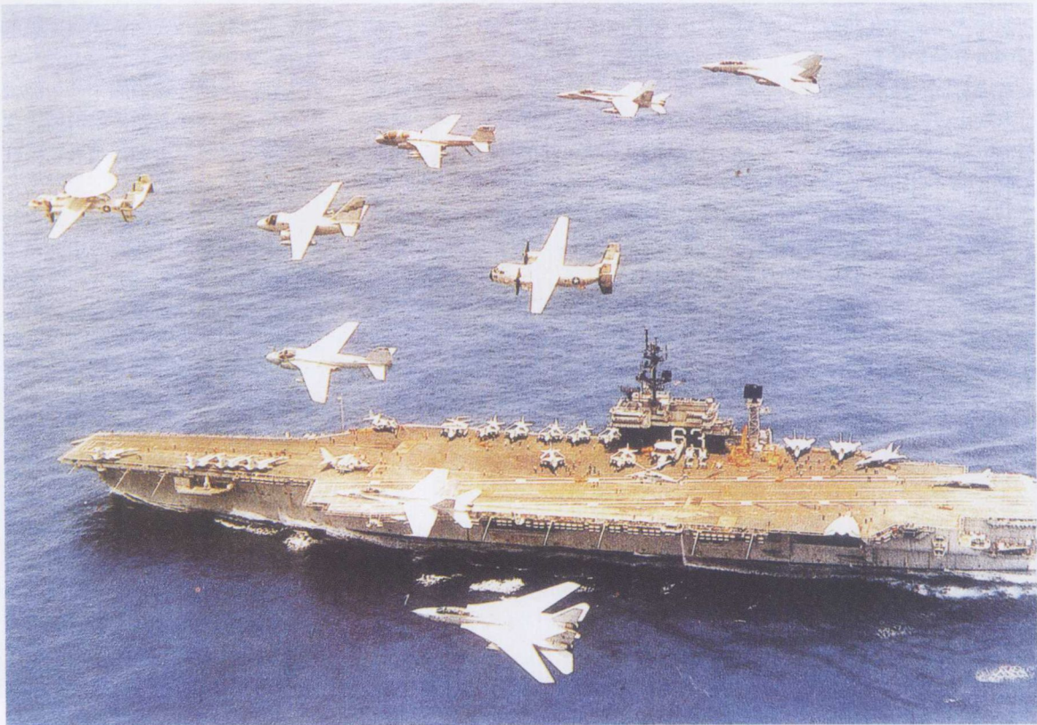
美国“小鹰”号航线与空中飞行编队