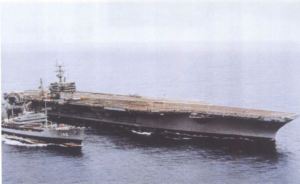
在太平洋上航行的美国“尼米兹”号航母正在接受“卡维希维”号补给船的加油