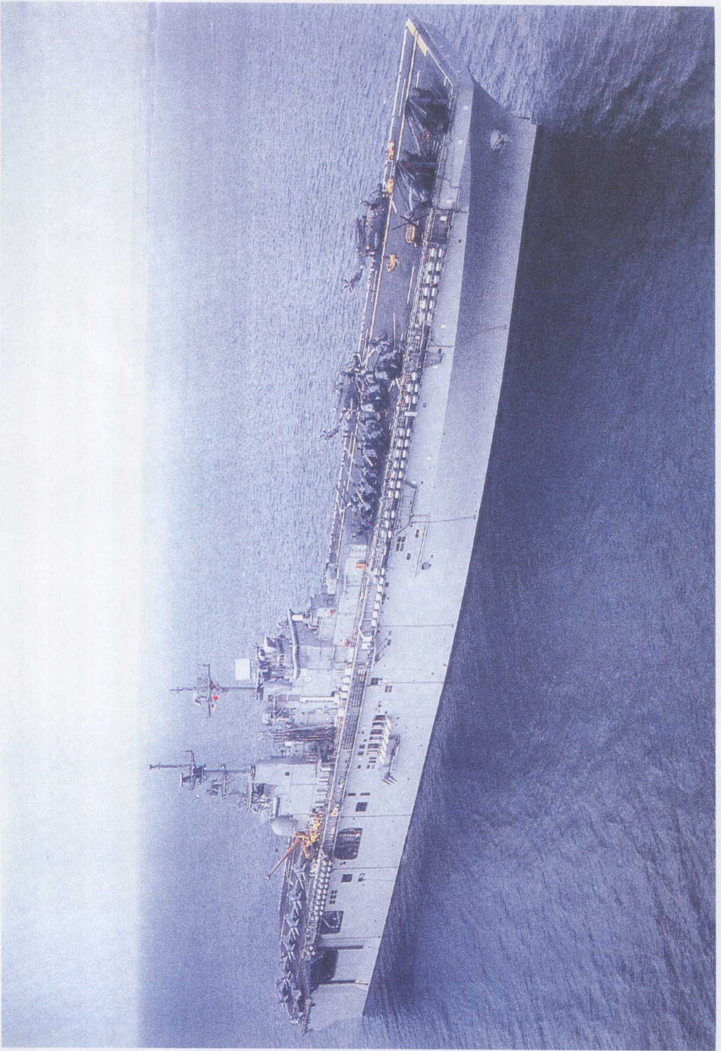
美国最新一级两栖攻击舰首舰“黄蜂”号