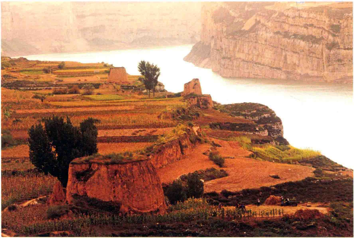
黄河边的明长城 2008年摄