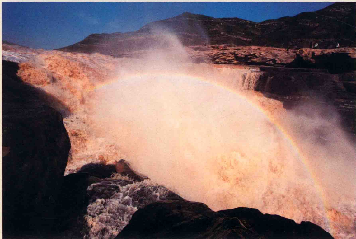
壶口瀑布 2008 年摄

“黄河落天走东海，万里写入胸怀间。”李白的诗吟唱出了中国人对于黄河的深情。黄河是中华民族的摇篮，它孕育了华夏光辉历史和灿烂文化。黄河在榆林境内流经府谷、神木、佳县、绥德、吴堡、清涧六个县，境内长约 350 多公里。