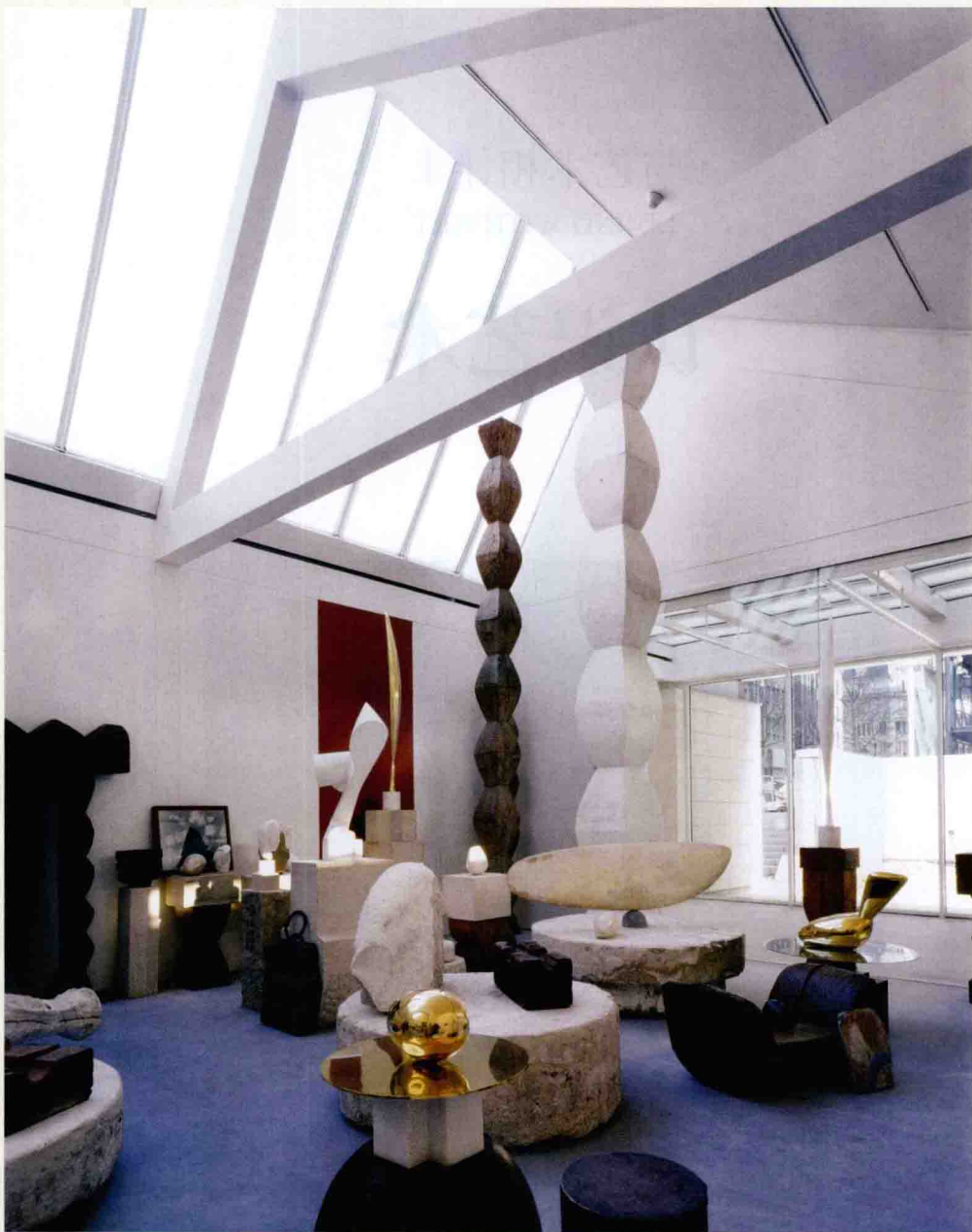
1.1 布朗库西的工作室。由伦佐·皮亚诺建筑工作室在乔治·蓬皮杜中心国立现代艺术博物馆内重建。1992—1996年