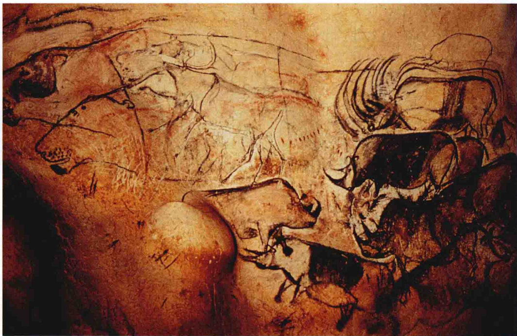
1.3 “狮子图”左部,肖维洞,阿尔代什山谷,法国。约公元前 30000 年

个巨大的“地下室”,那里满地都是凌乱的动物骨头。在向洞的更深处推进一段距离后,探险家用灯照亮洞壁,有了一个惊人的发现:洞壁上布满了描绘犀牛、马、熊、驯鹿、狮子、野牛、猛犸象和其他动物的线描图和彩绘图(1.3)——他们后来发现有 300 多幅画——以及大量的人手印。