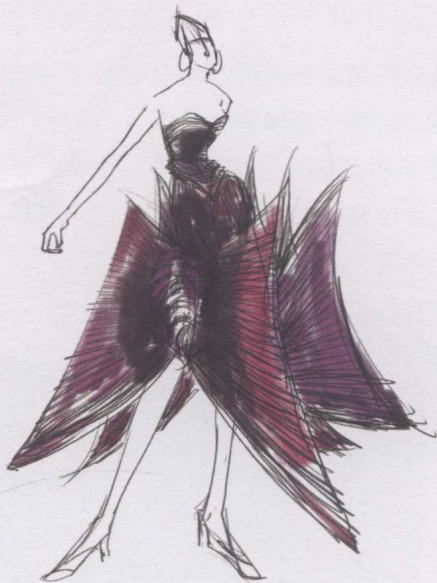
2. 为服装找出大致颜色。