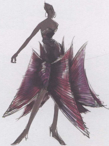
4. 使用水溶法把衣服的颜色晕染开。