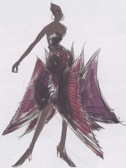
3. 为人物身体画上颜色。