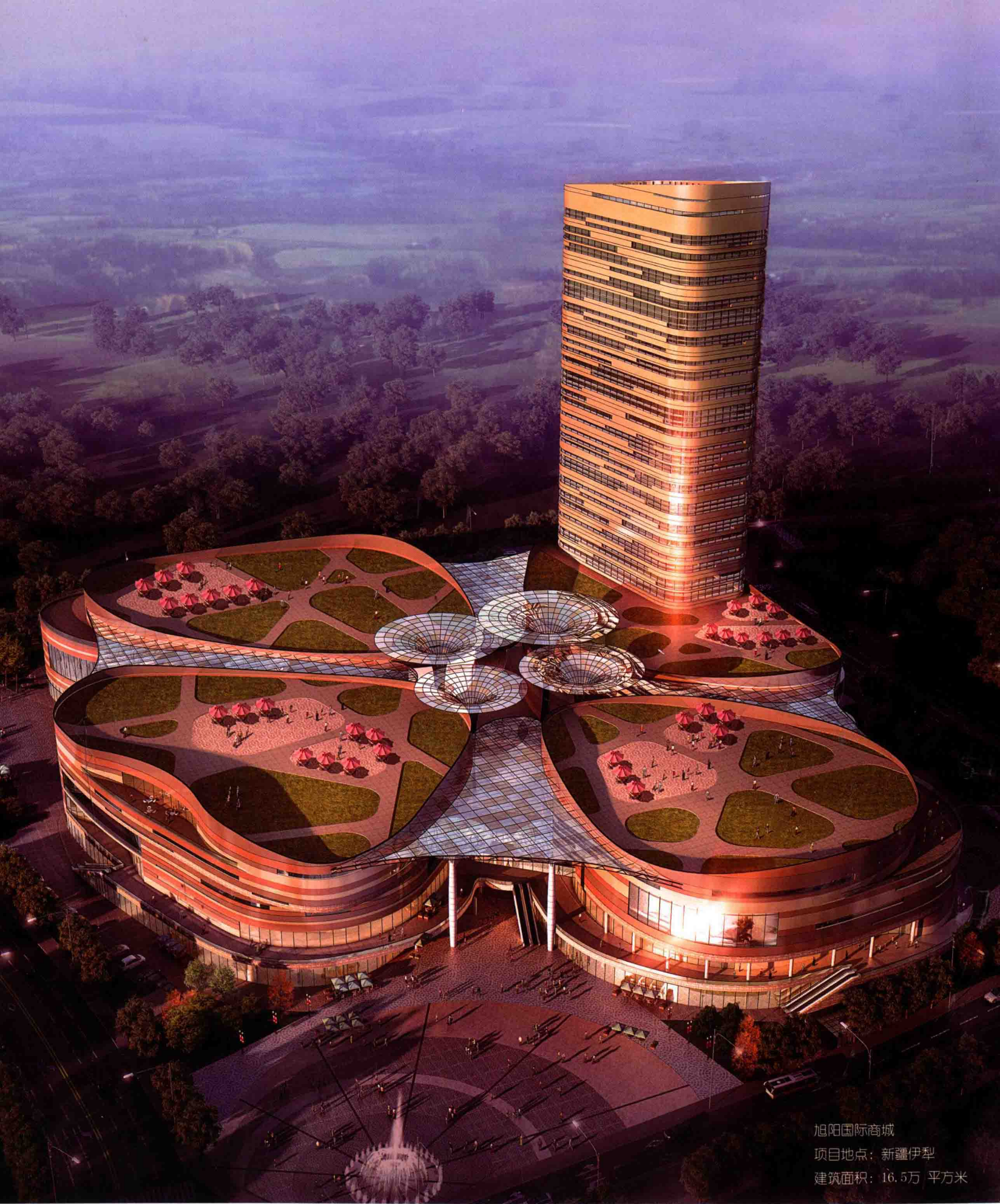
旭阳国际商城 项目地点：新疆伊犁 建筑面积：16.5万 平方米