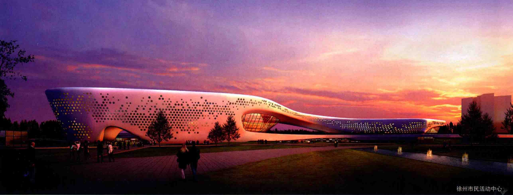
徐州市民活动中心