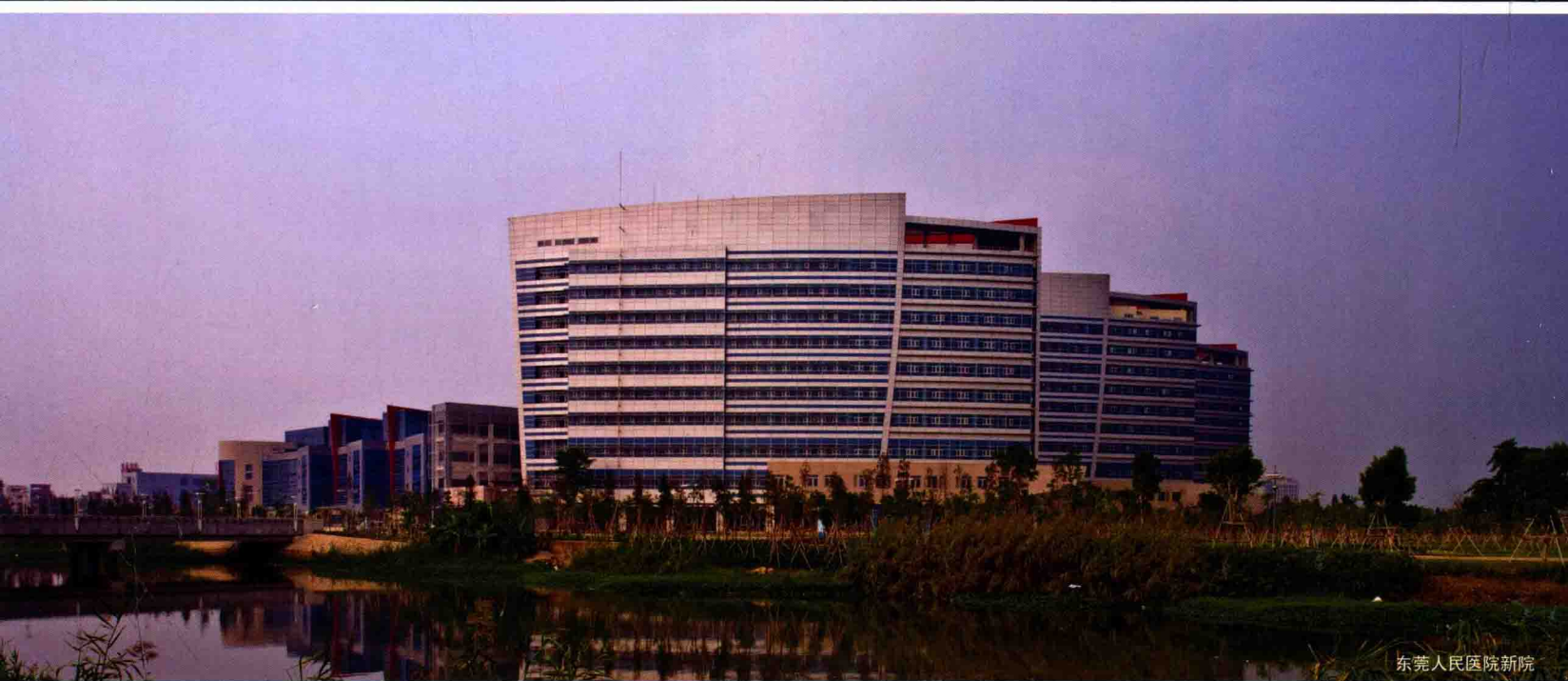
东莞人民医院新院