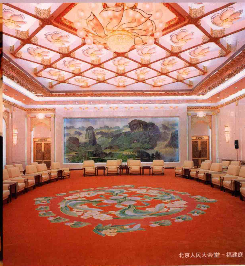
北京人民大会堂 - 福建厅