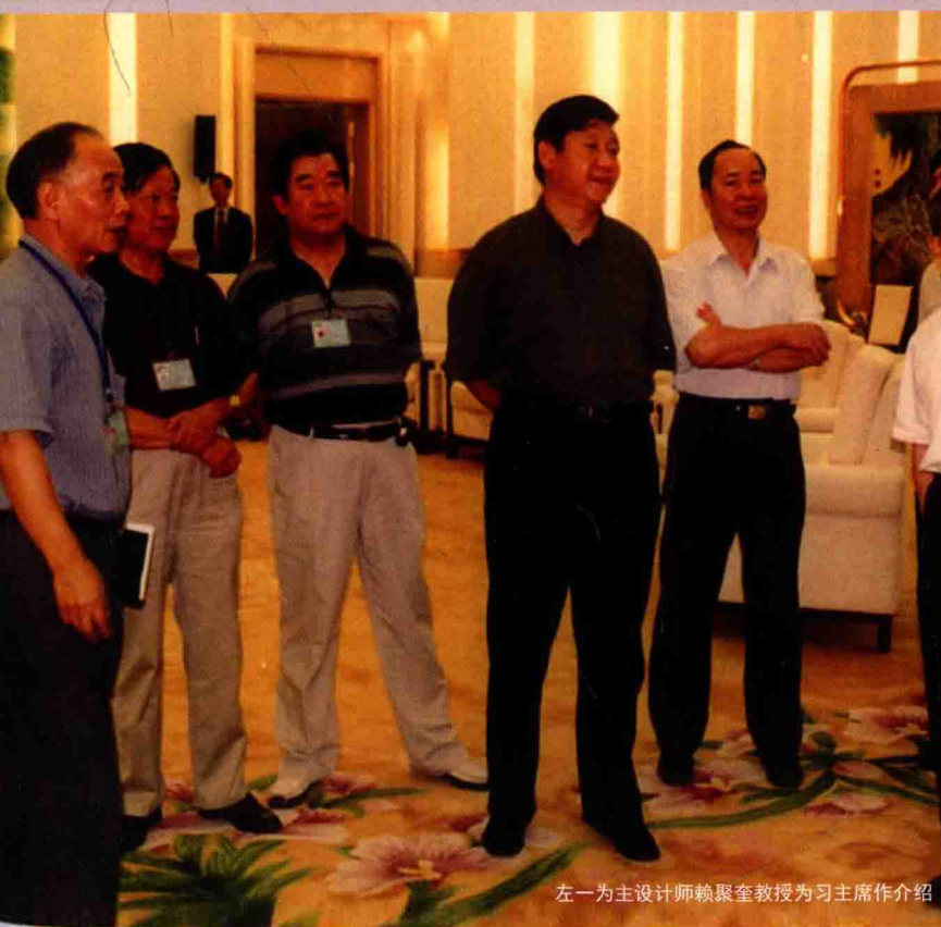
左一为主设计师赖聚奎教授为习主席作介绍