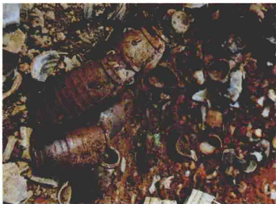
宜兴古窑遗址堆积物

福建、广东、台湾、香港、安徽、山东、北京等地，它对闽南、潮汕一带“功夫茶”的形成起过重要的作用。此外，宜兴紫砂陶制品在明清时代已远销日本、东南亚、南亚、欧洲等地，影响颇著，被欧洲人看作是世界上最珍贵的优良茶具，不仅谓之“红色瓷器”，甚至还加以仿制。近代以来，保持传统工艺特色的紫砂茶具曾出口到全世界近 60 个国家和地区。清光绪四年（1878），日本常滑陶工鲤江高须邀请宜兴紫砂艺人金士恒、吴阿根到日本传艺。直到今天，日本爱知县常滑“朱泥器”或称“朱泥烧”、“紫