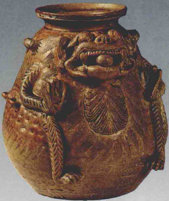
晋异兽尊，宜兴周墓墩出土。