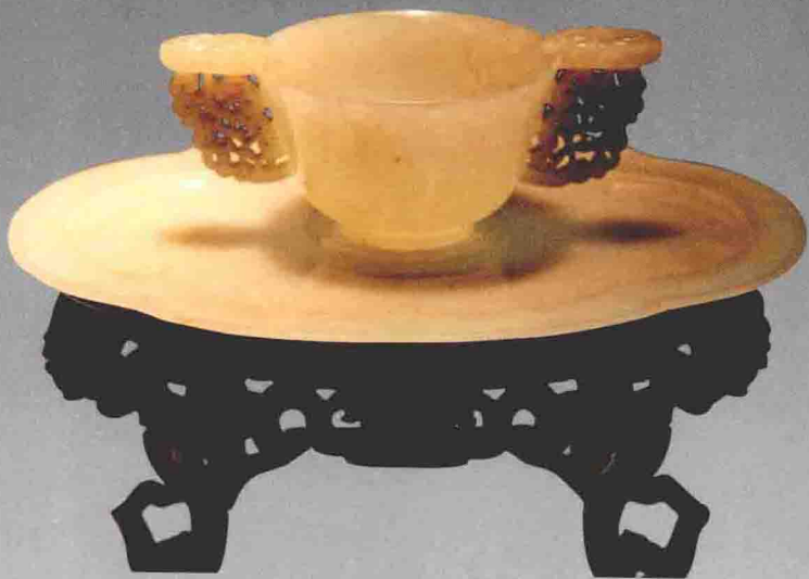
玉杯，中国茶叶博物馆藏。