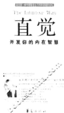
图2 身体的智慧： 直觉