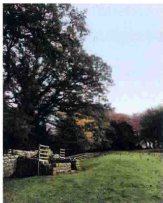
图1-8 哈德良长城一文都拉达罗马兵营遗址