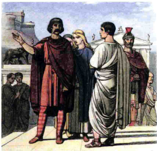
图1-6 卡拉克塔库斯在罗马

牺牲了，死时手上还拿着武器。他们一有机会就反抗，这不，又有个名叫苏维托尼乌斯 [30] 的罗马将军来了，他向被视为圣地的安格尔西岛（后来叫作莫纳岛） [31] 发起了猛烈的攻击，还把德鲁伊教的成员关进他们自己的柳条笼子里烧死，用的燃料也是教徒们自己的。可是，即便有他在不列颠，还带领着战无不胜的军队，布立吞人也照样起义。定居在英格兰的罗马人在掠夺布立吞王后博阿迪西亚 [32] 的财产时遭到了她的抵抗，这位王后是诺福克郡 [33] 和萨福克郡 [34] 统治者的遗孀。罗马军官卡图斯 [35] 一声令下，王后受到了鞭笞，她的两个女儿则在母亲面前惨遭凌辱，丈夫的亲戚们也沦为了奴隶。为了报复这一次侮辱，怒气填胸的布立吞人进行了不遗余力的反抗。他们将卡图斯赶到了高卢，毁掉了罗马人的财物，还把们逐出了伦敦——不过那时的伦敦还是一座贫困的小镇，只是个做买卖的地方罢了。几天之内就有七万罗马人丢掉性命，有的被吊死，有的被烧死，有的被剑刺死，还有的被钉死在十字架上。于是苏维托尼乌斯加强了自己的军队力量，前来攻打布立吞人。后者也壮大了自己的部队，在已被对方强势占据的土地上向苏维托尼乌斯的兵马发起了疯狂的进攻。在布立吞人发起第一波进攻之前，博阿迪西亚一面驾驶战车在军队间穿行，一面发出呼喊，要他们向压迫者——无法无天的罗马