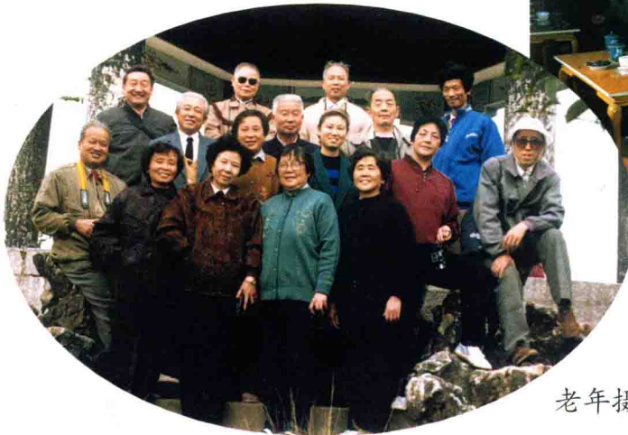
老年摄影班学员合影