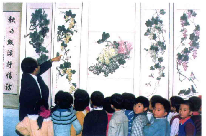
老师在指导学生参观