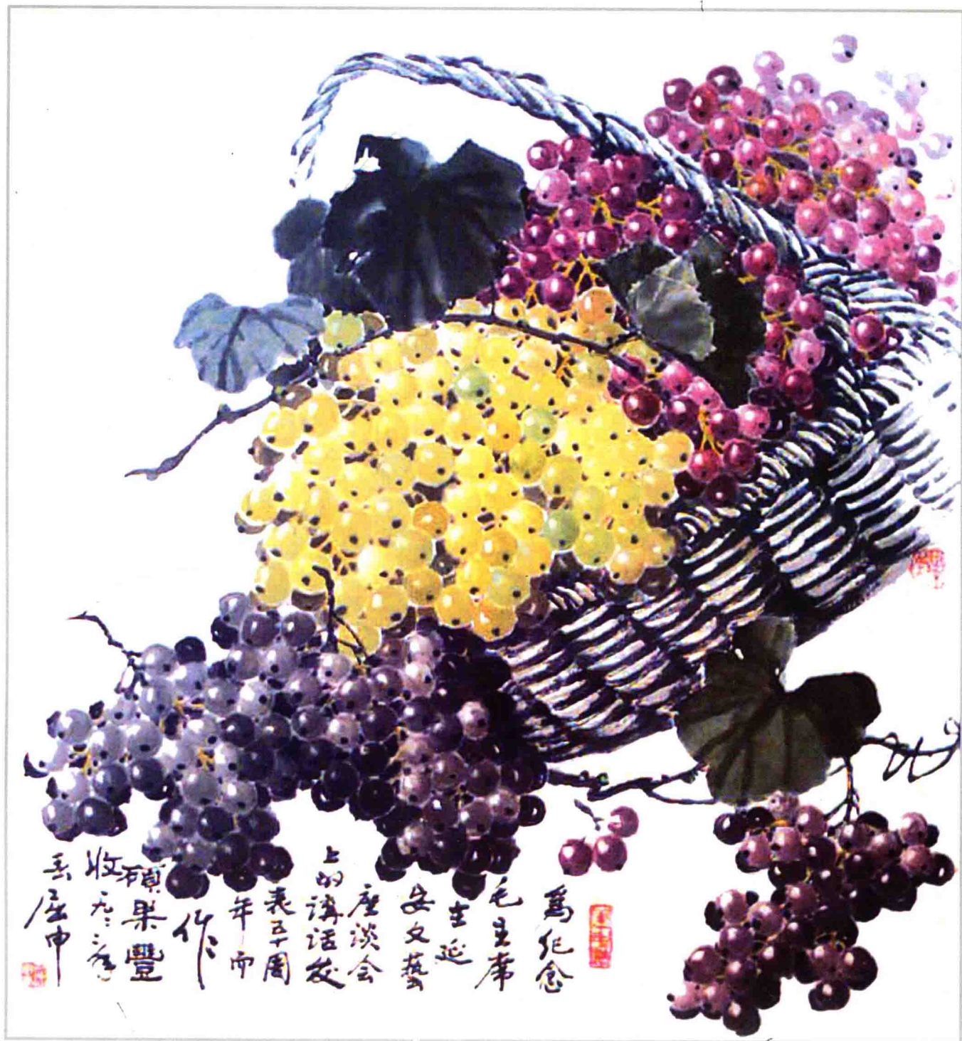
硕果丰收，为纪念毛主席在延安文艺座谈会的讲话发表五十周年而作，一九九二年荣获湖北省老年书画展览二等奖。