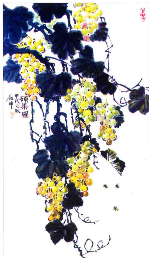
珠帐临簷挂 龙须满架抽