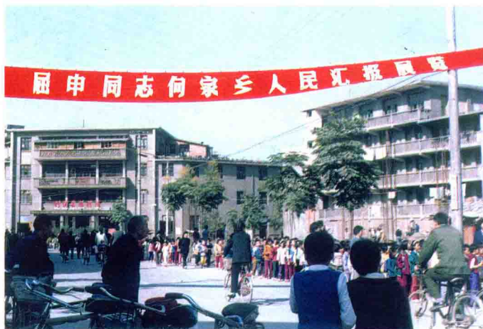
竹溪县文化馆展览外景