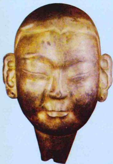
金陵出土的鍍金面具