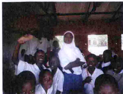
图 72 友谊纺织厂家属院里的小孩们