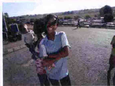
图 68 图 69 图 70 图 72 图 71