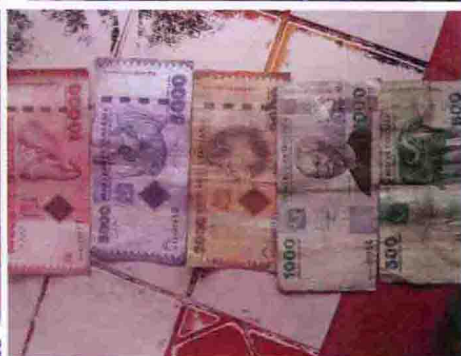
图 84 | 图 85