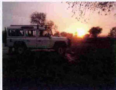
图 78 | 图 79