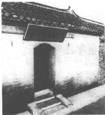
淮安驸马巷周恩来故居