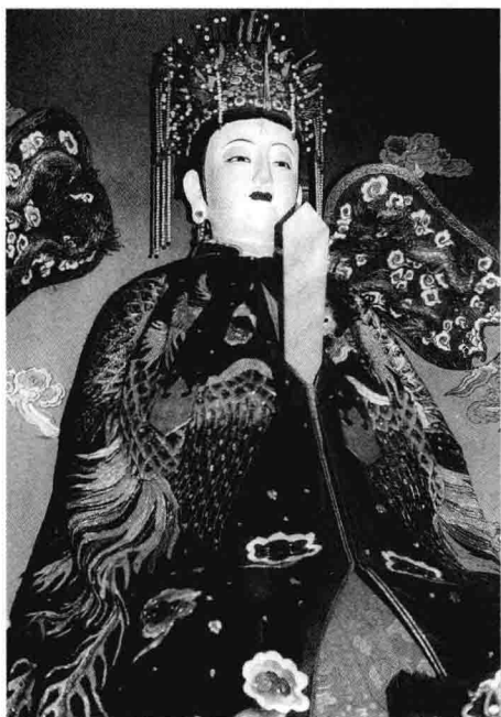
天后圣母塑像(1985年塑)

航行遇险时，更是企盼林默以超人的力量来救助。而每当人们渡过险风恶浪，则倍感林默保佑航程的灵验。久而久之，林默便渐渐成为人们敬仰膜拜的海上保护神。