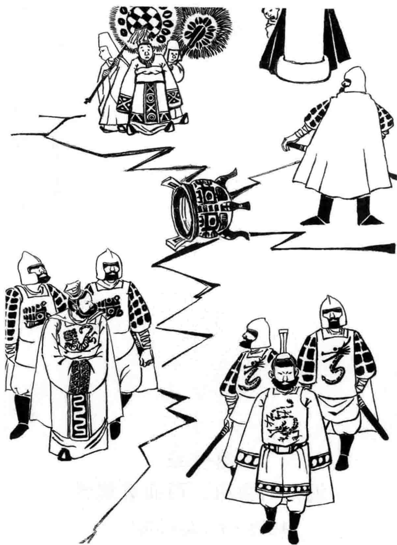
那个时代的皇帝也不好当 (陈德馨绘)