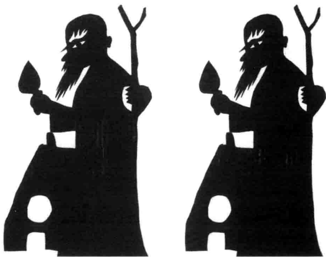
图 12 拖亚拉哈

周武王在白茫茫的北方的大雪上走啊走啊，有一天，他突然看见了前边的林子里飘出一股浓烟。他走过去一看，只见一个猎人正举着一个火把，走向一个土坑。