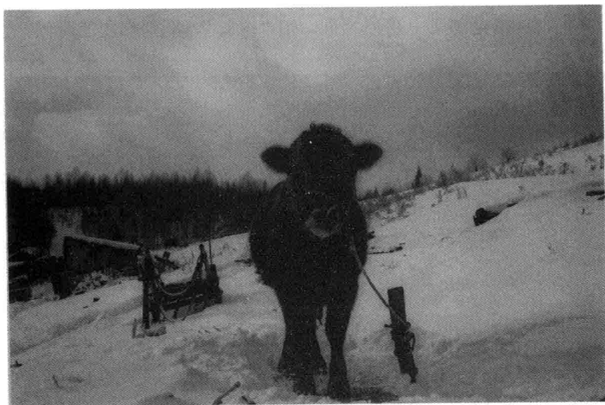
图6 牲口冻得在寒冷中打晃