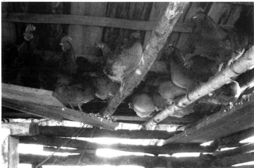
图4 鸡冻得上了房梁

牛们，马们，都披着厚厚的白霜，站在严寒中打颤。它们身上的毛已和冰雪结在一起，形成厚厚的冰凌，就像金属的铠甲，在冬天闪着清冷的光泽。