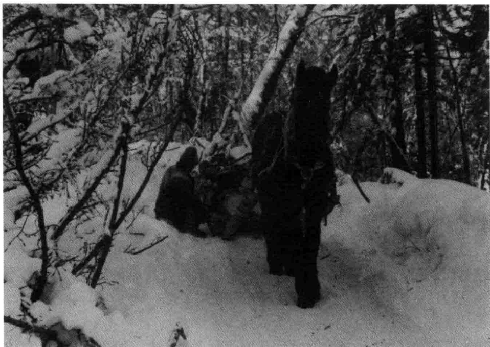
图 11 归宿在哪儿