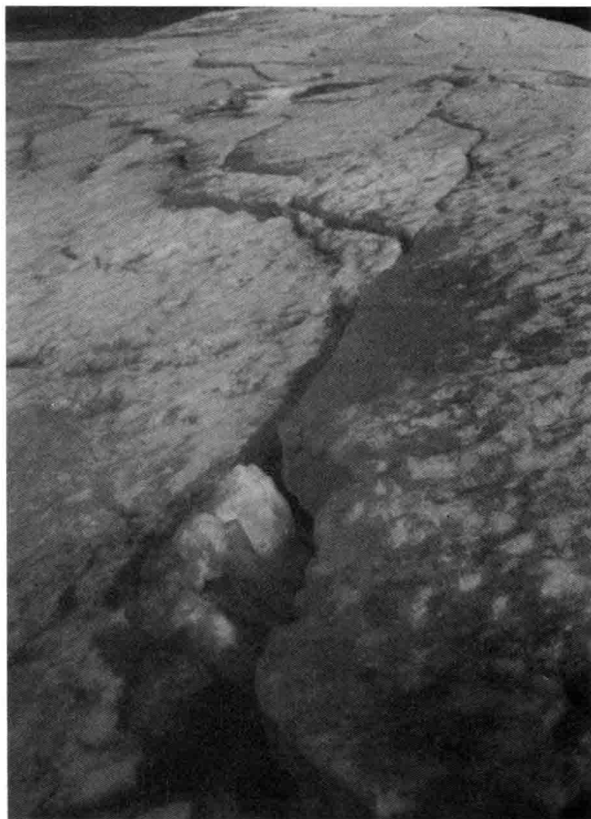
图2 严寒冻裂的江河