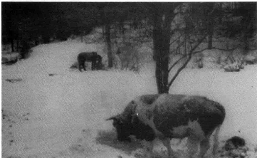
图5 牛马身上披着白霜

牛们，马们，都披着厚厚的白霜，站在严寒中打颤。它们身上的毛已和冰雪结在一起，形成厚厚的冰凌，就像金属的铠甲，在冬天闪着清冷的光泽。