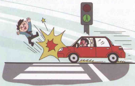
近18年我国发生交通事故统计