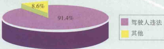
交通事故成因构成

造成道路交通事故的原因涉及人、车、路、环境、管理等诸多因素，其中，驾驶人的因素是引发道路交通事故的主要原因。在已发生的道路交通事故中，机动车驾驶人违法行为导致的交通肇事占事故总数90%以上，造成的死亡人数占事故死亡总人数91%以上。在道路交通事故中，因超速行驶、未按规定让行、逆行、违法占道行驶、违法会车、酒后驾驶、违法超车、疲劳驾驶等违法行为造成死亡的，占死亡总数的91.4%，其他行为仅占8.6%。驾驶人违法和无德驾驶行为，在相当长的时期内仍将是造成道路拥堵和导致交通事故的主要原因。