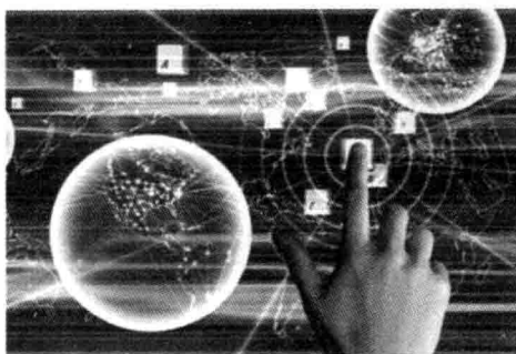
iUserTracker-2014年3月新闻门户网站日均覆盖人数排名

根据艾瑞咨询推出的网民连续用户行为研究系统iUserTracker最新数据显示,2014年3月,新闻门户网站日均覆盖人数达5466.7万人。其中,新华网日均覆盖人数达1118万人,网民到达率达4.5%,位居第一。