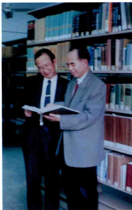
⑤作者在中山大学图书馆里切磋易学