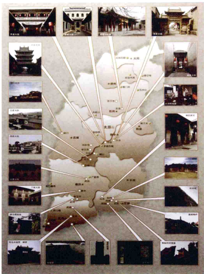
山西望族及晋商重点宅院分布图。

有事下乡，闻读书声即喜，亲到塾中与儿童正句读，语以作文……”主管教育工作的官员更是尽职尽责。嘉庆《灵石县志》记载，灵石县人张攀月，曾经在祁县担任教谕一职，其间，注重训导和奖励读书人，而且积极修建学宫。为了让更多穷苦人家的儿童也能接受文化教育，一些开明官吏还慷慨捐资或积极筹资开办义学。据《山西通史》记载，康熙十六年（1677），阳曲知县戴梦熊在县里筹资办起7所义学；康熙二十二年（1683），榆次知县助民间办起9所义学；雍正三年（1725），洪洞知县孔传忠捐资兴建义学5所；乾隆二十七年（1762），崞县（今山西原平）知县邵丰铨捐建义学6所。