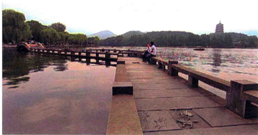
> 雷峰塔矗立在西湖岸边山中

独厚的自然条件有关。虎跑泉与龙井、玉泉、郭婆井、吴山大井，并称杭州五大“圣水”。更因虎跑泉水质特别纯净，世人将虎跑泉与龙井茶叶誉为“西湖双绝”。