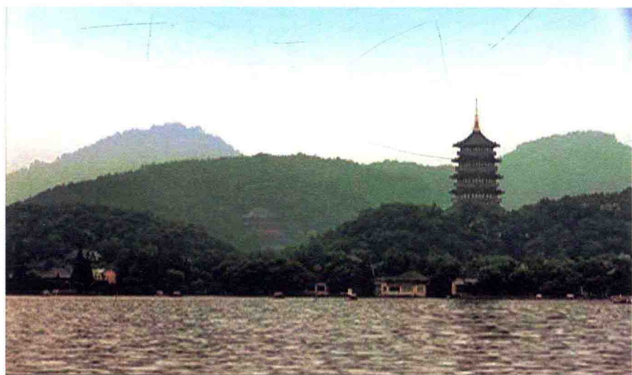
> 雷峰塔矗立在西湖岸边山中

西湖有三座人工岛屿：小瀛洲（三潭印月）、湖心亭（北塔基）、阮公墩。阮公墩是清嘉庆五年（1800）浙江巡抚阮元主持疏浚西湖后，以浚湖葑泥堆壅成岛的，故后人称之为阮公墩。其为西湖三岛中面积最小的一个岛。