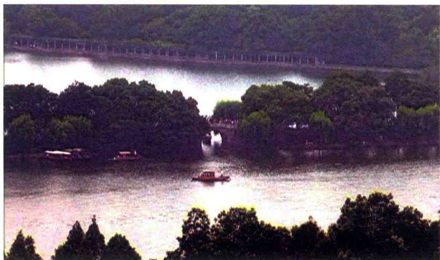
> 西湖中各部分水体靠桥孔相连