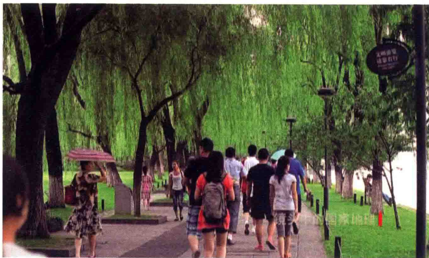
> 游人漫步在苏堤上

粉、桂花糖等。茶庄所备桌椅不多，春秋佳日，游客以涧边石块权充桌椅。1975年以后，园林部门分四期改造和新建九溪菜馆、茶室、接待室；整理山林环境，疏浚泉池，筑水坝，架画桥，布蹬道，造亭子，扩大游览面积。