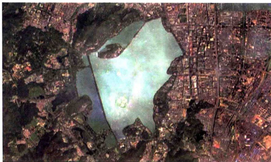
> 西湖各部分分割图

玉皇山介于西湖与钱塘江之间,海拔 239 米,凌空突兀,衬以蓝天白云,更显得山姿雄峻巍峨。每当风起云涌之时,伫立山巅登云阁上,耳畔但闻习习之声,时有云雾扑面而来,飞渡而去。