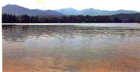
> 西湖水质得到改善