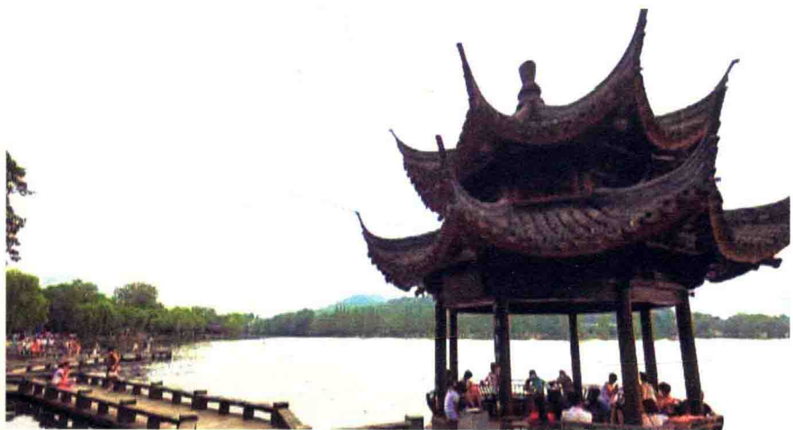
> 世界自然文化遗产地——杭州西湖

独厚的自然条件有关。虎跑泉与龙井、玉泉、郭婆井、吴山大井，并称杭州五大“圣水”。更因虎跑泉水质特别纯净，世人将虎跑泉与龙井茶叶誉为“西湖双绝”。