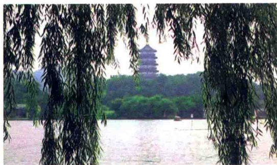
> 柳浪之中的雷峰塔

1950年后，新种植一批桂花树，至1955年前后，连同老树，树达万株，其中树龄最长的约200年，桂花成为当地村民重要的经济收入。一代传一代，终于造就了这一片“金粟世界”。如今更是家家户户皆植桂，房前屋后，村