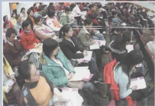
◀ “2005·学术前沿论坛”开幕式暨主论坛现场