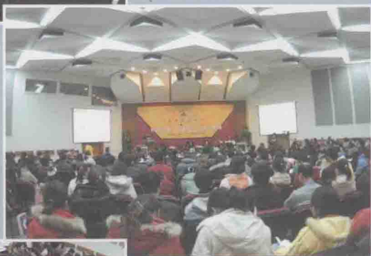
▶ “2005·学术前沿论坛”开幕式暨主论坛现场