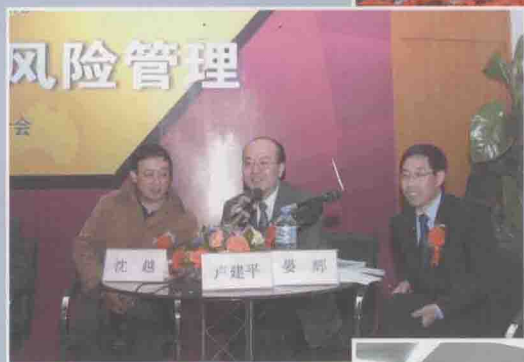
◀ 主题报告点评人 (左起：北京师范大学沈越教授、卢建平教授、晏辉教授)