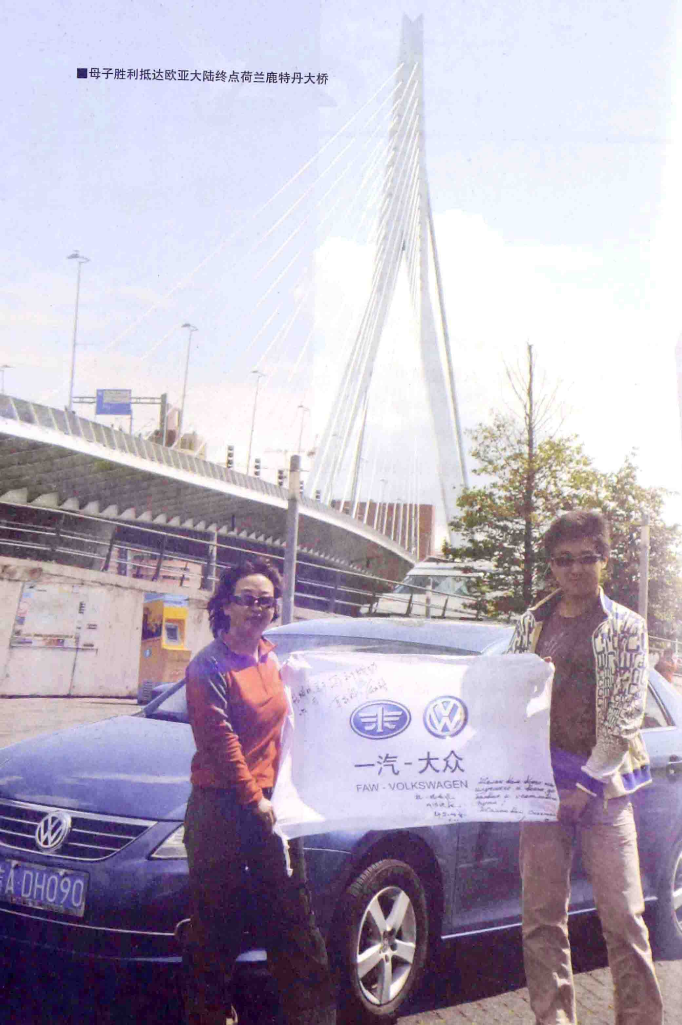
■ 母子胜利抵达欧亚大陆终点荷兰鹿特丹大桥