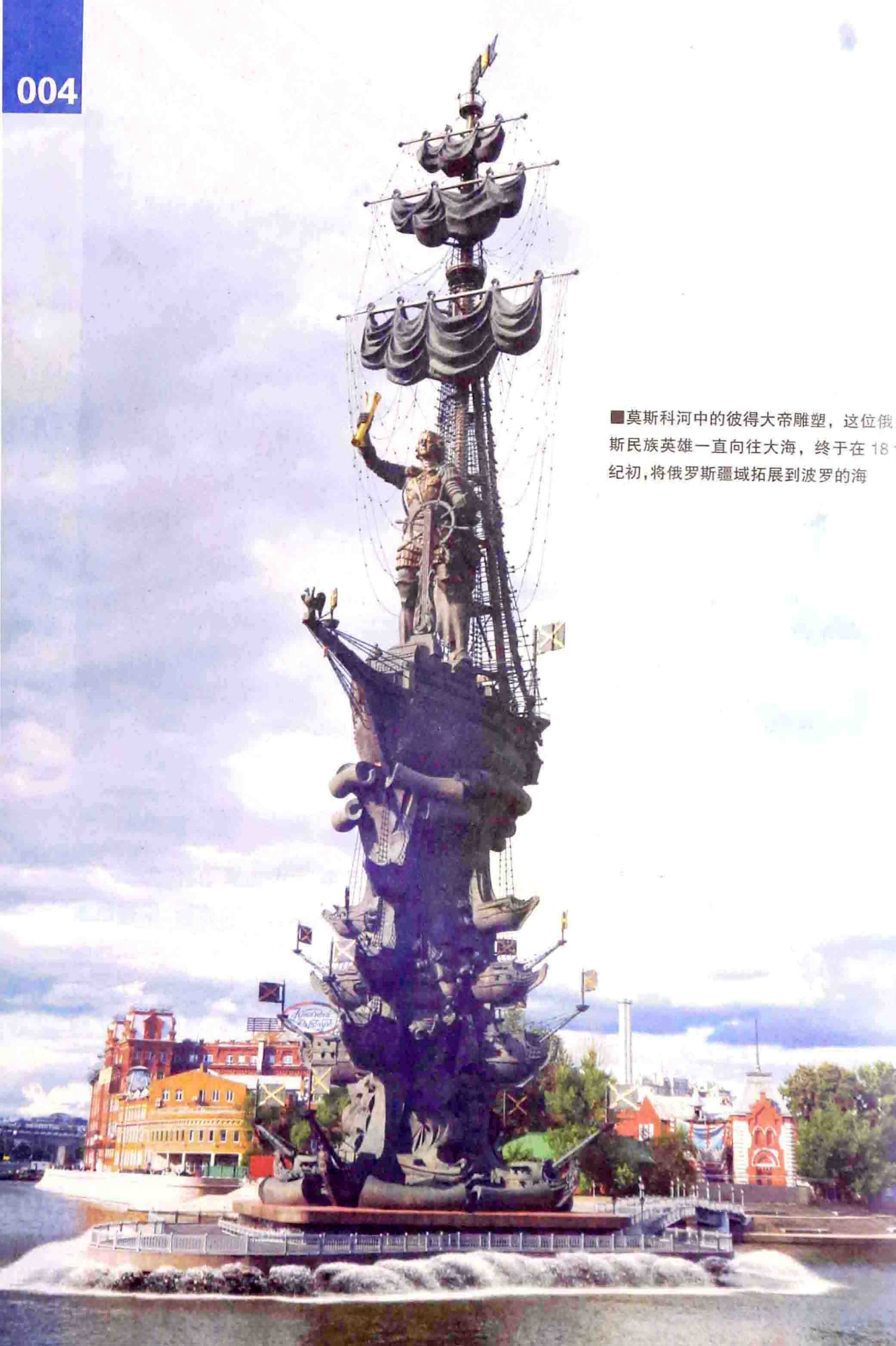
■莫斯科河中的彼得大帝雕塑，这位俄罗斯民族英雄一直向往大海，终于在18世纪初，将俄罗斯疆域拓展到波罗的海