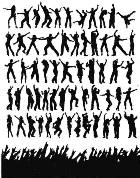
图 1-1 舞蹈的体态

“舞蹈是一门动的艺术”。舞蹈作为一门时间性和空间性的艺术，离不开人体的运动，运动的停止意味着舞蹈的结束，这一特性我们应当给予特别的强调。