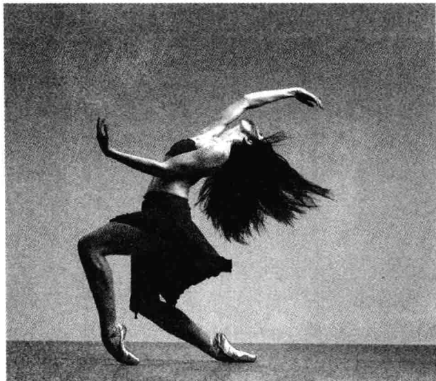
图 1-3 《两棵树》

蹈语汇，进行“树”的形象刻画，傣族传统舞蹈中的基本体态（“三道弯”特征）与特有的动态语汇，都成了塑造树的形象的动态媒介。杨丽萍用手表现两个相互缠绕的树枝，也用手表现空中婆婆的树叶，用手表达内心世界的激动，同时用手表达出男女情侣的关爱。这些都是通过手臂的动作变化实现的，可谓一手多用、一手多意。其次，上身的左右摆动以及与手臂的配合，也是该作品的重点，以此刻画营造缠绕拧曲的树的物象特征和造型，也体现出东方舞蹈所特有的曲线形审美与杨丽萍惯用的个性化体态特征。同时，上身、肩、手臂等局部类似卡通特征的短节奏性运动，也是该作品颇具神韵之处，一方面它与缠绕柔顺的长线条动作形成对比，另一方面它也为整个作品的结构设计营造了一种动作段落之间的反差，增添了作品的可观性与情趣性，耐人回味。