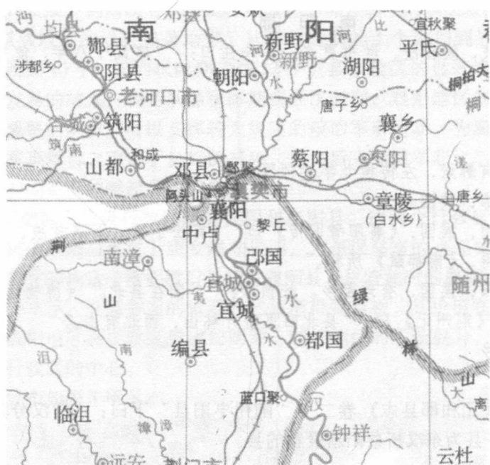
图4 东汉时期襄阳境内行政区划图