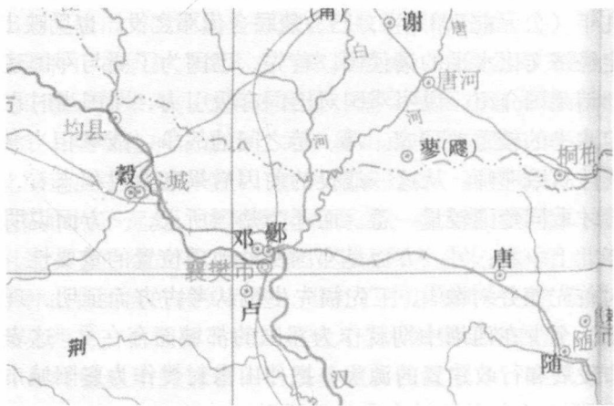
图1 春秋早期襄阳地区方国分布图