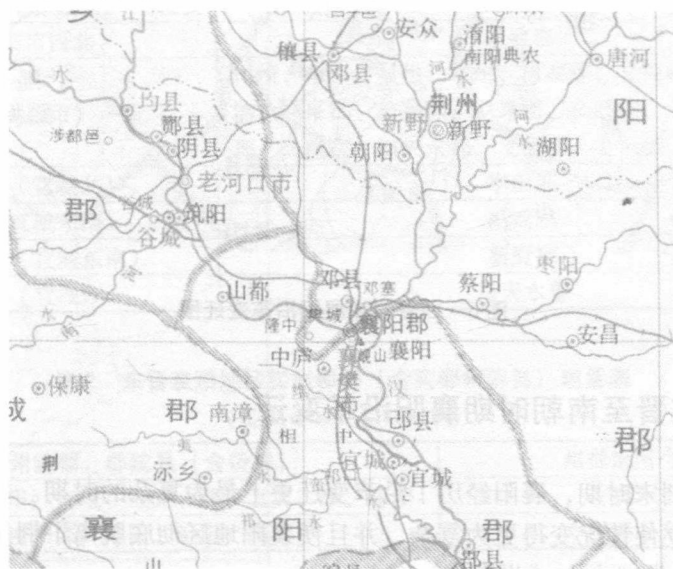
图5 三国时期襄阳境内行政区划图