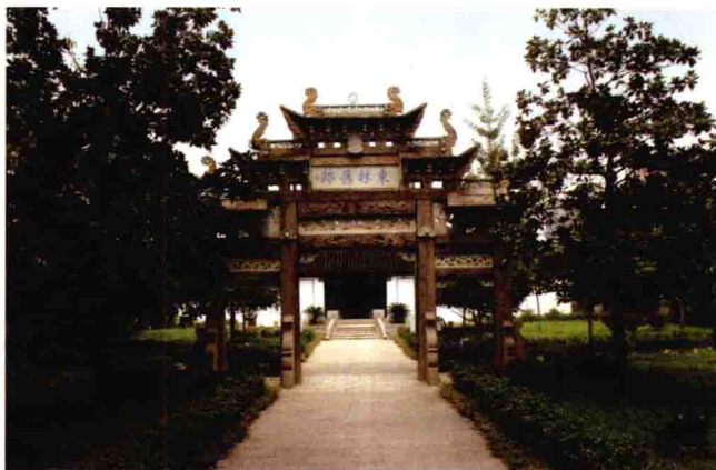
江苏无锡东林旧迹牌坊

时当权阉魏忠贤专权乱政，东林党同志常聚会黄氏官邸，品评国是。黄宗羲随侍侧旁，听父辈议论政事，心中逐渐明了朝廷是非。天启五年（1625），因黄尊素反抗宦官专权，受到魏氏阉党陷害，被革职归乡。次年二月，阉党李实承魏忠贤旨意，诬劾应天巡抚周起元、左都御史高攀龙、吏部员外郎周顺昌以及缪昌期、李应升、