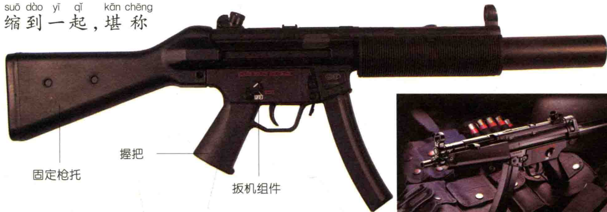
装有固定枪托的 MP5A2 冲锋枪