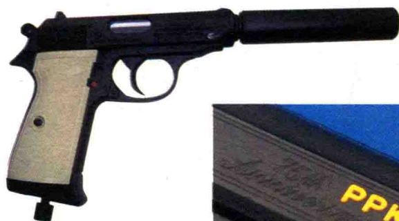
装有消声器的 PPK 手枪

cáng shǐ yòng qǐ lái yě fēi cháng fāng biàn 藏，使用起来也非常方便。