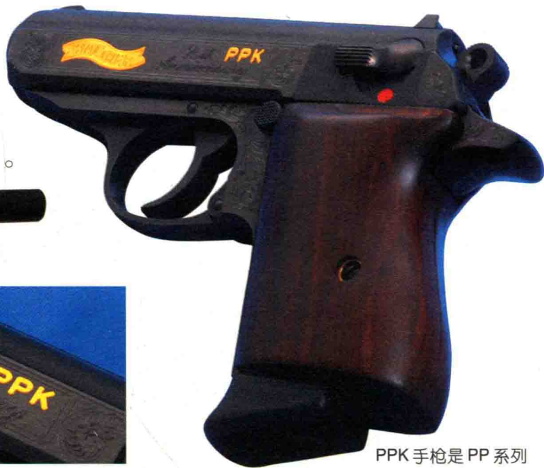
PPK 手枪是 PP 系列 手枪中的一种