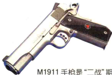
M1911 手枪是“二战”期间主要的单兵自卫武器