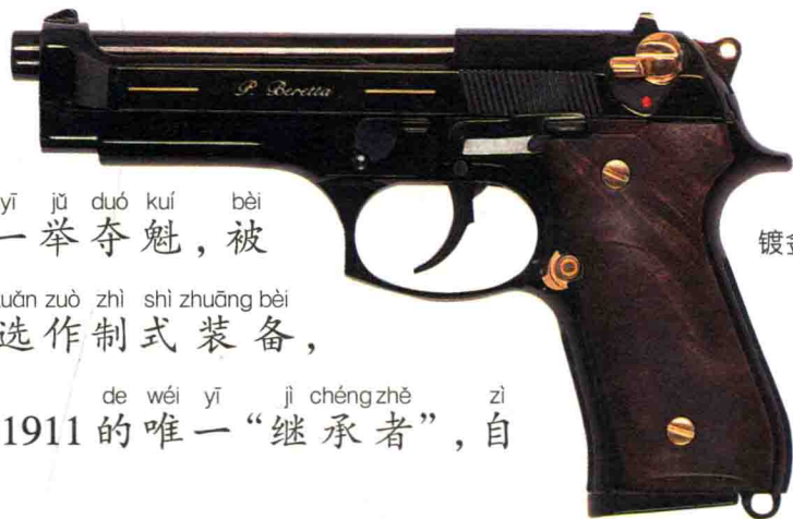
镀金的 92F 手枪