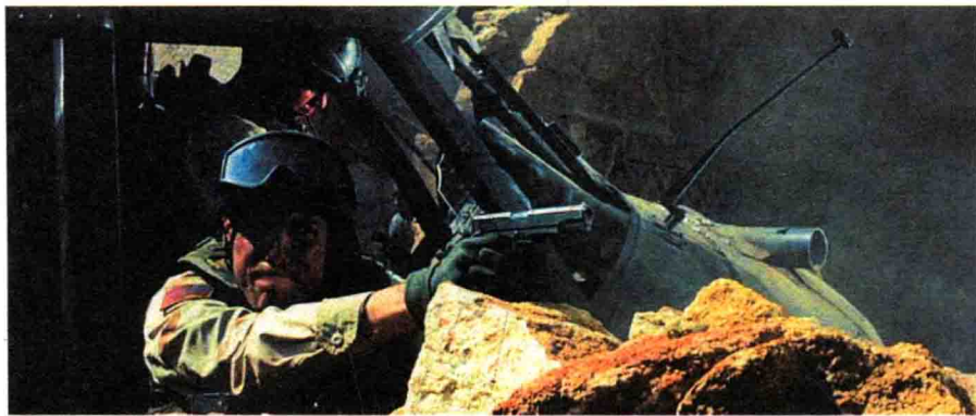
在影片《黑鹰坠落》中，美国士兵使用的是 M1911A1 手枪