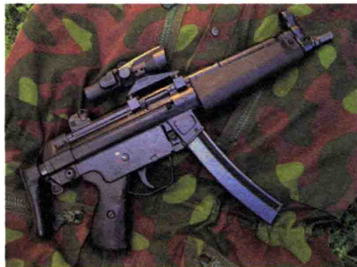
民用型号 HK94K 冲锋枪