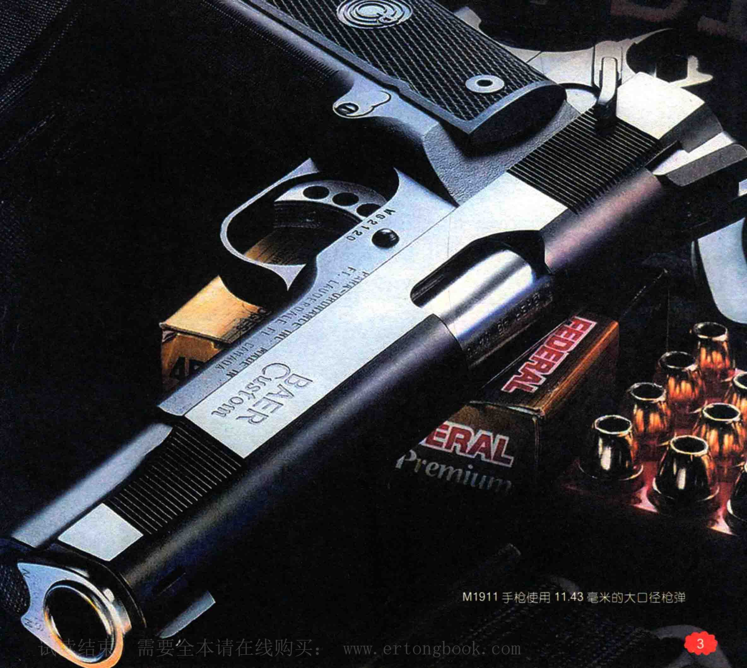
M1911 手枪使用 11.43 毫米的大口径枪弹