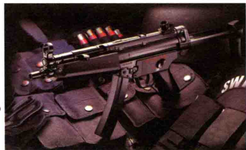
MP5 冲锋枪的型号很多，共有 120 多种版本