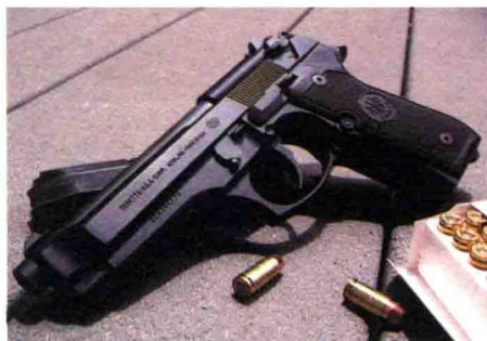
92F 手枪被美军选中后改名为 M9 手枪