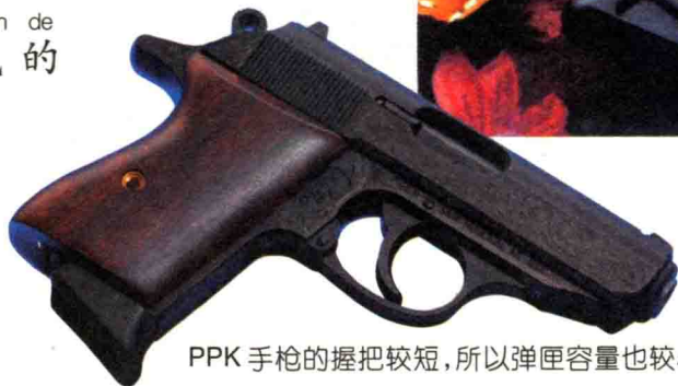
PPK手枪的握把较短，所以弹匣容量也较小