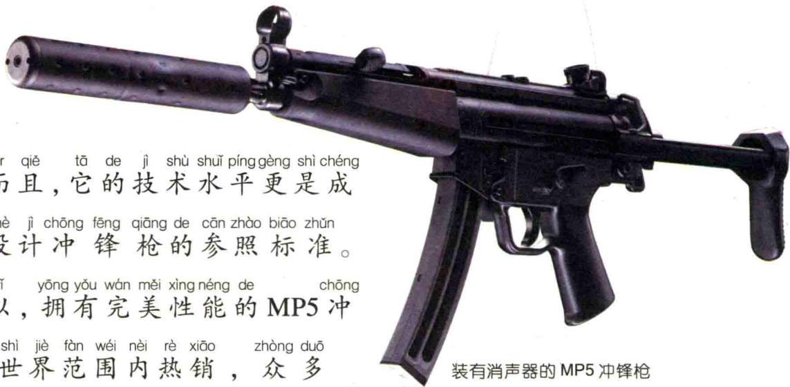
装有消声器的MP5冲锋枪

wán měi ér qiě tā de jì shù shuǐ píng gèng shì chéng 完美。而且，它的技术水平更是成