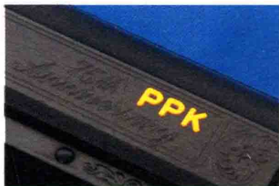
手枪枪管上的“PPK”标志特别显眼