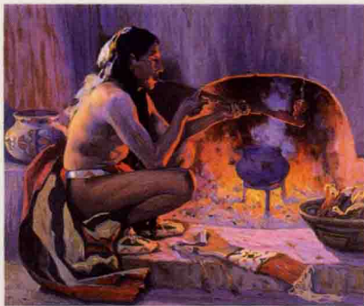
吸烟斗的印第安人

烟草在植物学分类上属于茄科烟属，起源于中、南美洲。世界上最早吸食烟草的无疑是美洲大陆的印第安人。印第安人吸食烟草是源于他们的宗教活动之需，其时的人们，在祭祀时点燃烟草。燃烧的烟草能够散发出醉人的香气，能够提神解乏，甚至还有镇痛治病的功效。因此，很快印第安人就不再把吸食烟草仅仅作作为宗教活动中所需的仪式，而在他们的日常生活中推广开来。