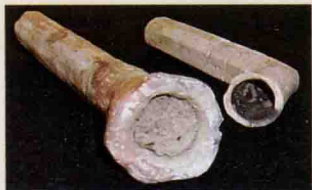
出土的印第安人陶质烟斗

日常生活，吸烟方式和烟具的简便成为人们追求的目标，于是，“原始烟斗”经过逐渐的演变，进化成现代意义上的烟斗，烟具的简便易操作又反过来刺激了烟草吸食流行，于是，吸烟成