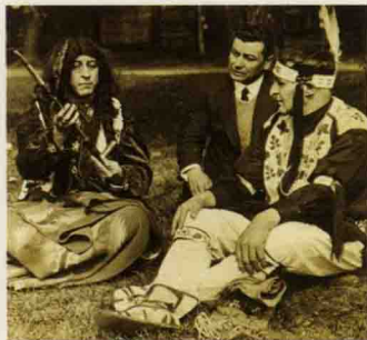
印第安酋长以烟斗待客

当烟草和烟斗传入欧洲之后，吸烟最初还只是流行于上流社会，当时的王公贵胄们把吸烟当做一种时尚和