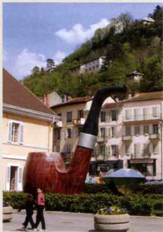
矗立在法国圣克劳德城内的 硕大的烟斗

石楠根烟斗的出现是烟斗发展史上一个划时代的革命事件，石楠根烟斗以其外表的美观，内在良好的吸烟品质，以及相对低廉的价格，一经出现，就立刻在各个阶层的烟斗使用者中引起了强烈的反响，由此一发不可收拾，在其后将近两个世纪的时间里，风行世界，历久不衰。