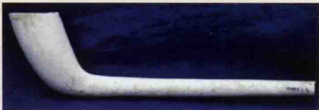
古老的欧洲陶土烟斗

最早的现代意义上的烟斗是陶土烟斗。陶土烟斗制作工艺简单，价格低廉，所以一经出现就获得了广泛的认可，受众甚广，但陶土烟斗也有着其自身无法规避的缺