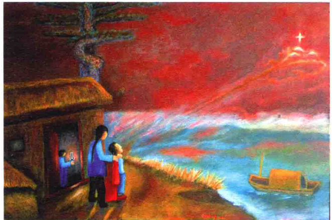
夜半哭泣的母親 2011 91 x 61 cm