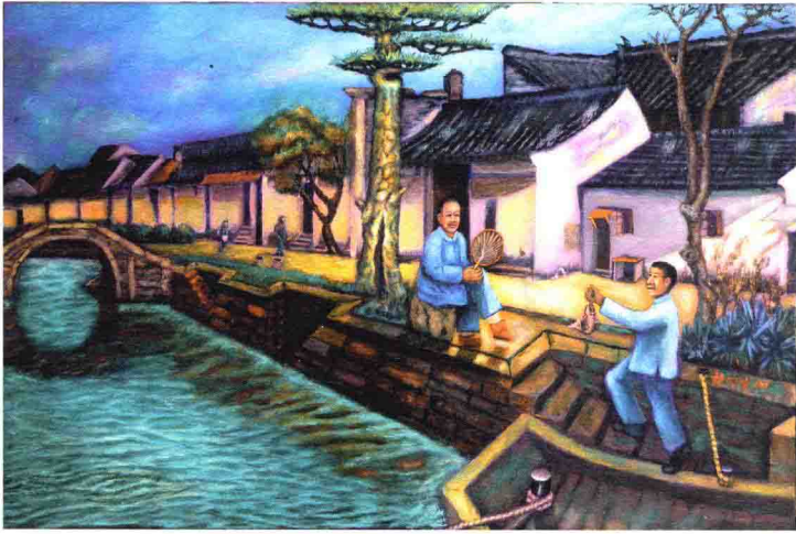
親關親情 2001 91 x 61 cm

主義的瀰漫。而夏卡爾在二次大戰期間及戰後繪畫的主題是什麼呢？是戰爭、是猶太人的受迫害，但他永遠不忘記在繪畫中間，加上釘在十字架上受苦的基督。這個受苦的猶太人，竟然堅持繪畫不應只是畫世界崩解，也應繪畫出支撐崩毀世界的信念。他堅持人類應有愛、信念與信仰。他終日與聖經為伍，晚年還致力於詮釋聖經。