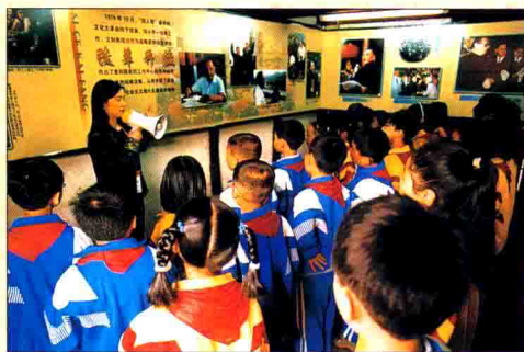
▲ 邓小平故居已成为全国青少年爱国主义教育基地