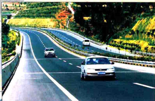
▲ 广安市高速公路实现了县县通