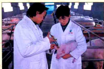
▲ 全面实施生猪换种工程