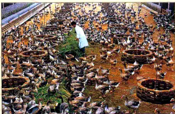
▲ 集繁育、饲养、加工、出口为一体的明瑰鹅养殖基地