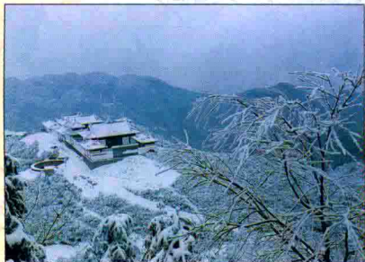
▲ 平麓山迷人的雪原风光