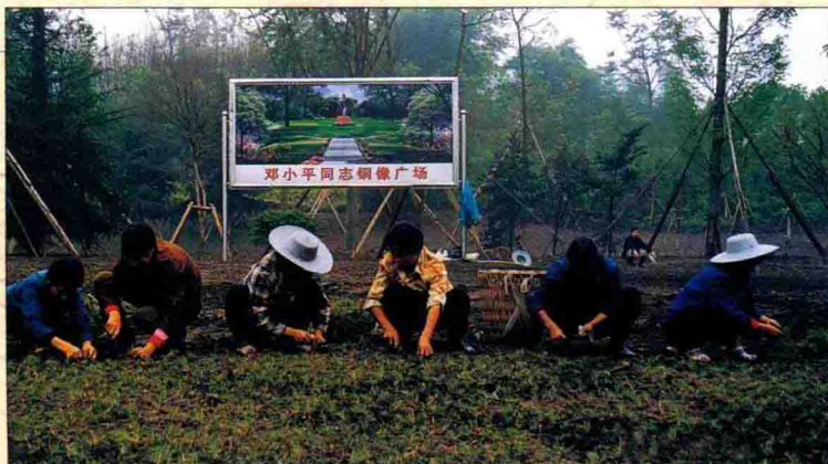
▲ 牌坊村乡亲在邓小平铜像广场植草