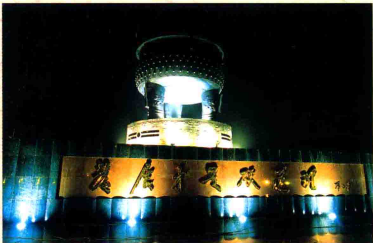
▲ “实事求是”宝鼎现重41.8吨，通高10米，是目前世界第一大青铜宝鼎。