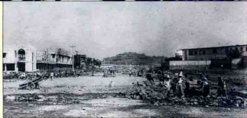
▲ 广安思源大道初建时原貌