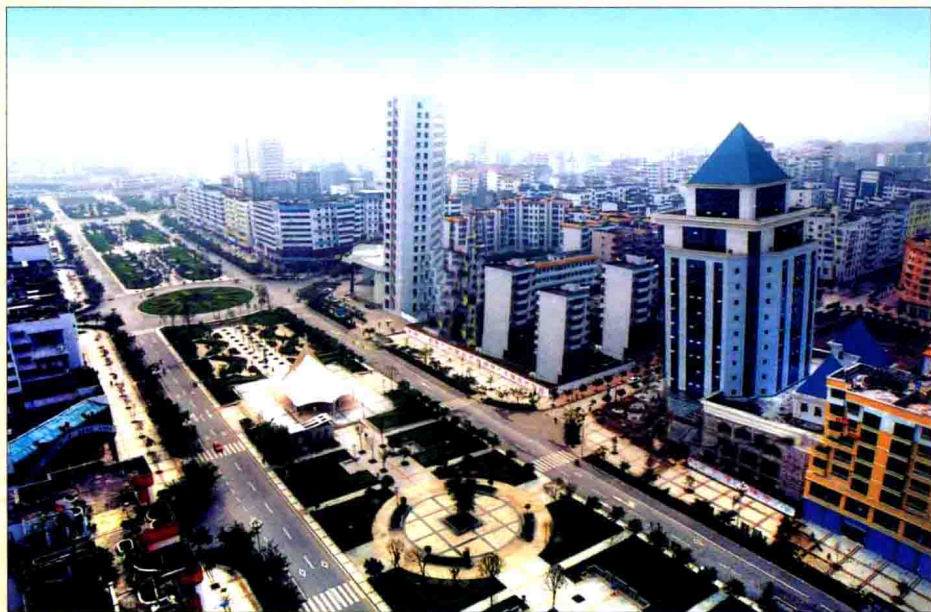
▲ 广安思源大道全景