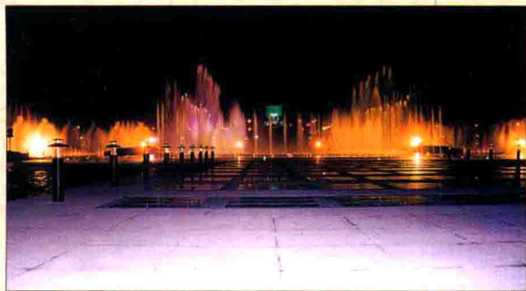
▲ 西部最大的音乐喷泉