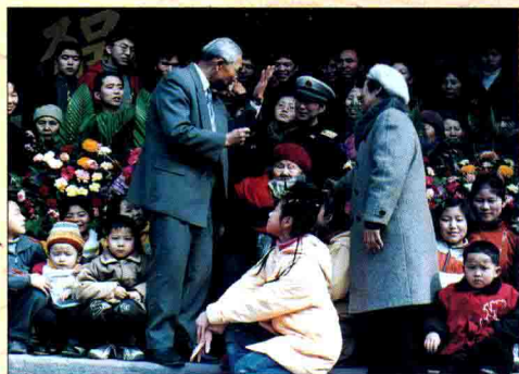
▲ 请战斗英雄讲故事