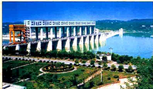
◀ 装机容量18万千瓦的东西关水电站