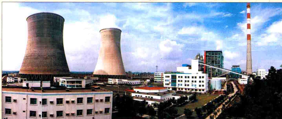
▲ 广安发电厂将建成“西南最大的火电厂”