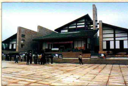
▲ 正在建设中的邓小平纪念馆陈列室