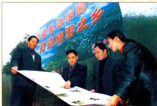
▲ 实施华莹山生态旅游建设