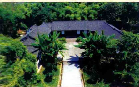
▲ 郁郁葱葱的邓小平故居