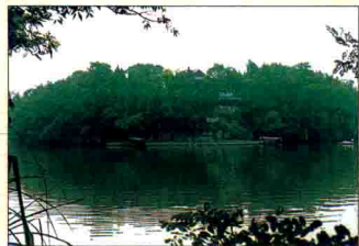
▲ 翠柏掩映的龙华阁