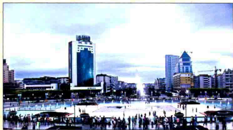
▲ 集纪念、旅游观光、休闲娱乐于一体的思源广场