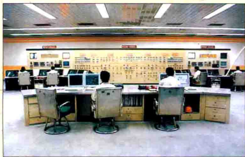
▲ 丰富的电力资源为广安的跨越式发展奠定了“坚实基础”