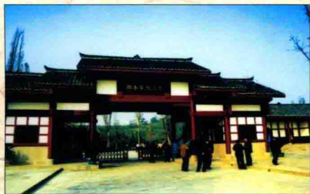
▲ 邓小平纪念馆新大门