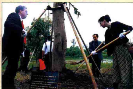
▲ 外国友人参加“我为小平故里植棵树”