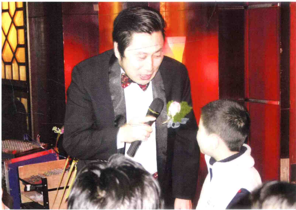
主持人要善于现场即兴找“托”

有一次，我去农村主持一个婚礼，一位老太太拉住我说：“你这个司仪年纪大，说得好，挺有水平。不像前几天那个司仪，那才有趣呢，太死板了！那天明明下着毛毛细雨，可那司仪出发前还是说：‘阳光明媚，欢声笑语……’让我牙都快笑掉了！”我另外还听朋友讲过：一次他参加农村亲戚的婚礼，新人正准备出发，村口一棵大树上有一只黑乌鸦，“呱呱”乱叫，可那司仪照样说：“喜鹊叫喳喳。”旁边就有人说：“说什么呢，那明明是乌鸦。”所以，主持人说话一定要得当，要善于运用即兴的语言，一定要讲究语言艺术。