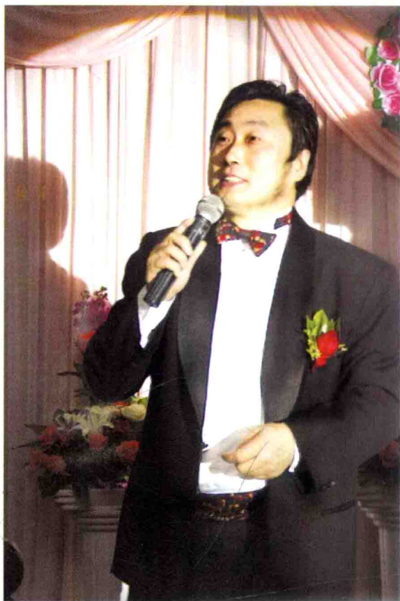
主持人要有声、台、形、导、表，说、学、逗、唱、演的功力