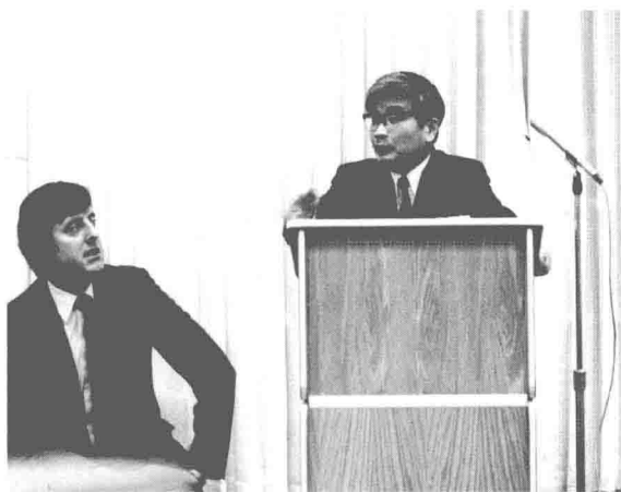
1985年3月14日在美国芝加哥-肯特法学院介绍 “中国法律的近年来发展”(旁坐者为该法学院院长)