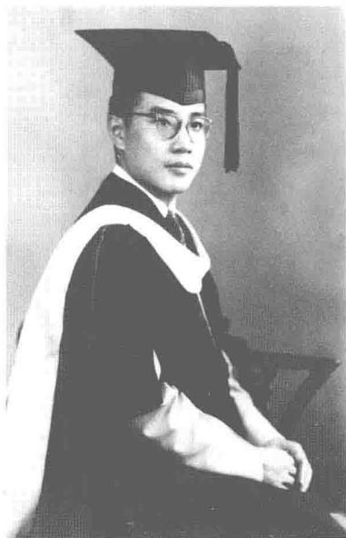
1948年于美国宾夕法尼亚大学 获硕士学位