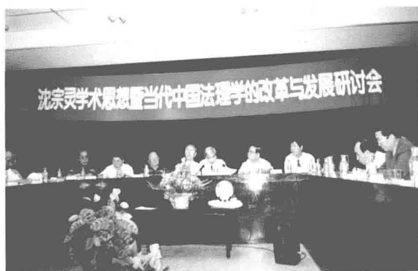
1998年9月在“沈宗灵学术思想暨当代中国法理学的改革与发展”研讨会上宣读论文(右起第5人为沈宗灵教授)