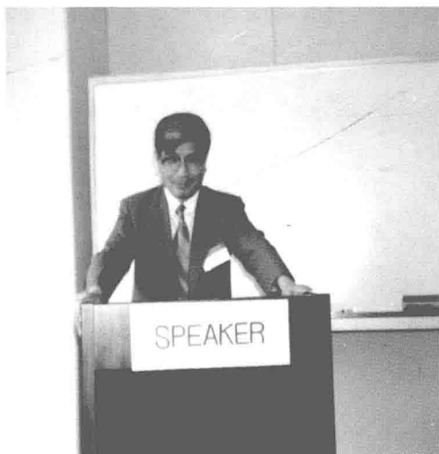
1987年8月在日本神户举行的国际法律哲 学与社会哲学学会分组会上宣读论文